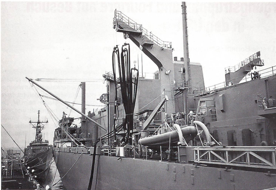
USS Arctic, Fast Combat Support Schiff.