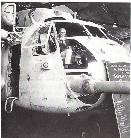
Hptm Bucher im Super Stallion.

Auf unserem Reiseprogramm stand nun: Besuch einer kombinierten Gefechtsübung. Diese wurde durch den Hurrican vereitelt. Wir sahen den Sturm kommen. Obwohl die Soldaten die riesigen Rolltore rasch schlossen, war der Hallenboden in Tornähe null-komma-plötzlich überschwemmt. Als Ersatz für die leider ausgefallene Gefechtsübung besuchten wir noch einen grossen Hangar, wo Helikoptermech ausgebildet und Heli repariert werden. Hier waren für uns verschiedene Helikopter ausgestellt, u a der riesige Super Stallion. Als weitere Alternative zum verregneten Nachmittag hörten wir einen Vortrag über moderne Heli-Pilotenausbildung im Simulator. Wir durften einen solchen Simulator, der aber