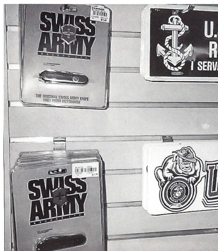
Im Warenhaus Marine Corps Exchange entdeckt... No comment.

Über Nacht hatte sich das Wetter unter dem Einfluss des gerade in Florida tobenden Hurricans Opal verschlechtert. Nach der Begrüssung in der Naval-Base und einem ersten Vortrag konnten wir das Versorgungsschiff USS «Arctic» besichtigen. Von aussen sieht so ein Schiff aus wie ein schlafender Riese. Innen wimmelt es wie in einem Ameisenhaufen. Man musste gut aufpassen, dass man sich treppauf und treppab in den vielen Gängen nicht verlor. Endlich konnten wir Briefmarken kaufen, am Schalter der Feldpost im Schiff! Das Schiff kann sehr viele Güter laden, dazu kommt noch die ganze Versorgung und Infrastruktur der Besatzung. An Bord ist vom Coiffeur bis zur Zahnarztpraxis alles für die Leute vorhanden. Da gibt es keine faulen Ausreden, man sei auf See und habe nicht zum Figaro gekonnt. Der Haarschnitt hat perfekt zu sein, basta. Wir kamen mit den Angehörigen der Navy rasch ins Gespräch, und wir konnten