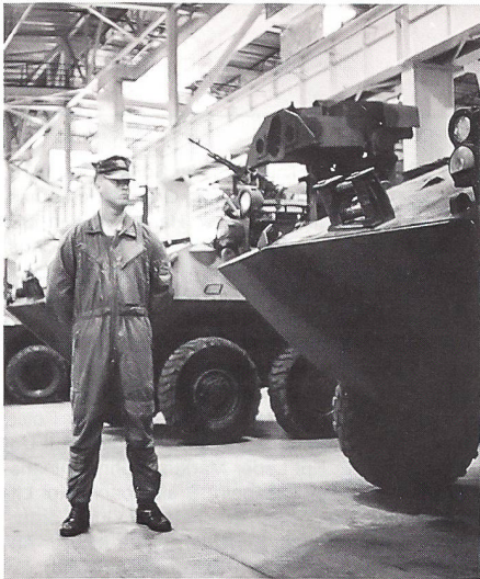
Ausstellung des Marine Corps, verschiedene Piranhas (MOWAG auch in den USA).

schlossen. Keine langen Haare, keine schlampigen Tenüs. Eine einmal «eingefuchste» Gruppe bleibt für immer zusammen, ausser wenn es Abgänge gibt, kommt ein Neuer dazu. Sie kennen ihr Gerät bis ins Detail. Man spürt es auch, es wird Sorge getragen, es ist «ihre» Flab-Kanone. Je nach Einsatz werden diese Gruppen zu Einheiten zusammengestellt. Hier lernten wir die Verpflegung der US Army im Feld kennen. Täglich möchte ich nicht während Wochen so essen müssen. Nach dieser Erfahrung werden wir wohl alle mit der Kost unserer Armee, die so oft kritisiert wird, wieder zufriedener sein.