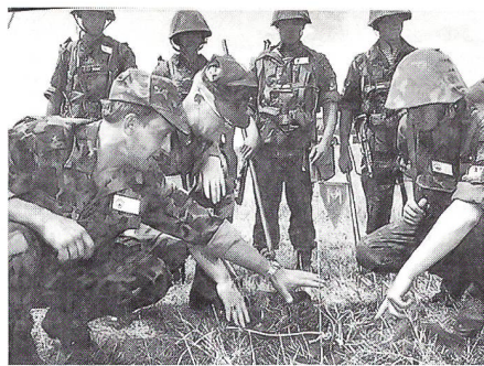
Ukrainische und amerikanische Soldaten untersuchen im Juli 1995 in der Ukraine während gemeinsamer Übungen für friedenserhaltende Massnahmen eine Landmine.

Die Ukraine unterstützt die Initiativen der NATO, mit denen die Bündnispartner insbesondere durch die NAKR-Mechanismen und das Programm der Partnerschaft für den Frieden (PPF) enger mit den Staaten Mittel- und Osteuropas sowie mit anderen Mitgliedstaaten der Organisation für Sicherheit und Zusammenarbeit in Europa (OSZE) verbunden werden sollen; sie sind ein anschauliches Beispiel für diesen Prozess des Wandels. Das Engagement für diese neue Partnerschaft ergibt sich nicht nur aus dem In-