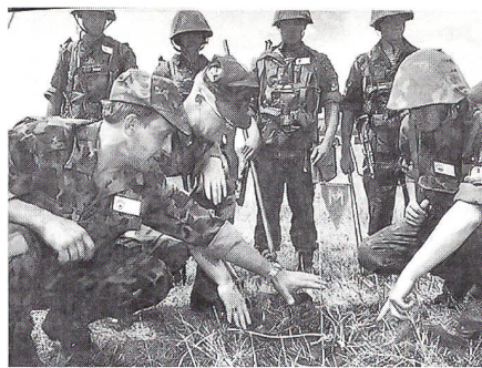
Ukrainische und amerikanische Soldaten untersuchen im Juli 1995 in der Ukraine während gemeinsamer Übungen für friedenserhaltende Massnahmen eine Landmine.

Die Ukraine unterstützt die Initiativen der NATO, mit denen die Bündnispartner insbesondere durch die NAKR-Mechanismen und das Programm der Partnerschaft für den Frieden (PPF) enger mit den Staaten Mittel- und Osteuropas sowie mit anderen Mitgliedstaaten der Organisation für Sicherheit und Zusammenarbeit in Europa (OSZE) verbunden werden sollen; sie sind ein anschauliches Beispiel für diesen Prozess des Wandels. Das Engagement für diese neue Partnerschaft ergibt sich nicht nur aus dem In-