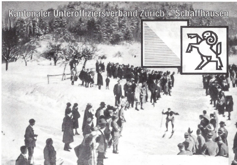
Impressionen vom Bachtel-Winterwettkampf: zu Beginn der dreissiger Jahre...

Bei der Formulierung der Texte konnten die Verfasser auf verschiedene frühere Prospekte als Vorlage zurückgreifen, während bei den Illustrationen ausschliesslich neue Aufnahmen organisiert werden mussten. Die Suche nach geeigneten Bildern gestaltete sich denn auch als eine der aufwendigsten Ar-