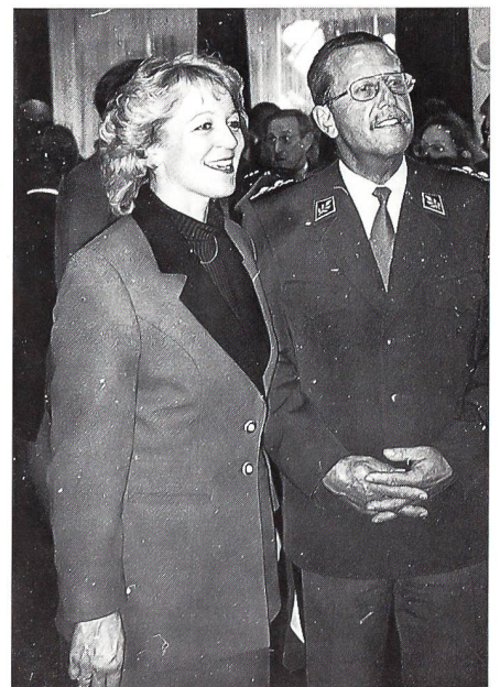
Regierungsrätin Rita Fuhrer vom Kanton Zürich mit Ulrico Hess, Kdt der F Div 6.

Im Rückblick erwähnte Hess u a die Ohnmacht internationaler Organisationen. Friedensbemühungen können nur dann erfolgreich sein, wenn man auch zum Einsatz von Machtmitteln bereit sei. Noch nicht alle hätten gelernt, dass aus Instabilität und Unsicherheiten Gefahren erwüchsen, die vielleicht zu ernsthaften Bedrohungen werden können.