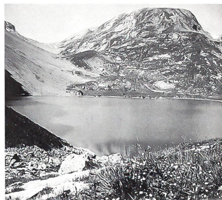
Am Iffigensee am 29. Juli 1943

rote Augen. Ich weiss genau, was ich zu tun habe, nur eben... Nach der Mittagsverpflegung nehme ich «das Herz in beide Hände», rufe die classe quatre zu mir und entschuldige mich bei ihnen. Wir schütteln uns die Hand und allen, besonders mir, ist es wieder wöhler! – Der Aufstieg führt über den Rücken vom Hohberg zum Sätteli, das wir um 9 Uhr erreichen. Oben am Iffigenhorn erspähen wir ein Rudel Gamsen. Für viele der bergungewohnten Samariterinnen ist es ein Ereignis. Inzwischen scheint uns die Sonne längst auf den Buckel, endlich dürfen wir den Waffenrock ausziehen. Unter uns liegt der See, welch' eine friedliche Stimmung! Bald lagern wir uns an seinem Ufer, 2065 m. Alles, was der Bergfrühling hervorzaubert, blüht: Soldanellen, Anemonen, Vergissmeinnicht, Alpenveilchen, Enzianen, eine Augenweide! Wir Fahrerinnen haben uns etwas abseits installiert. Bei uns und den Samariterinnen frage ich, wer noch nie ein Edelweiss gesehen habe. Es melden sich 5. Ich gehe mit ihnen zu dem vorher gesuchten Hang und ein jedes darf sich ein