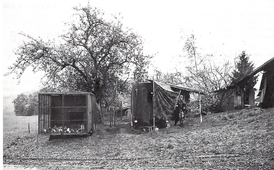
Zwei der sechs mobilen Brieftaubenschläge, deren beflügelte Bewohner einst von Soldaten und neu von Züchtern betreut werden. Die in diesen fahrbaren Schlägen untergebrachten Brieftauben sind ausschliesslich für die Zucht und für wissenschaftliche Studien reserviert. So erhofft man sich etwa neue Aufschlüsse über die Orientierungsfähigkeit der gurrenden Boten.

Zum ersten sind sie ausserordentlich zahm, robust und anpassungsfähig. Dies beruht auf einer versteckten züchterischen Selektion: Während vieler Jahre diente ein bestimmter Taubenstamm als Ausbildungsmaterial für Brieftaubensoldaten, und so wanderten alle Tiere ab, die – aus Brieftaubensicht gesehen – laienhafte Behandlung schlecht ertrugen. Übrig blieben Tauben, die sich rasch an wechselnde Bezugspersonen, tapsige Brieftaubensoldaten und permanente Störungen im Schlag gewöhnen. Solches Laientum findet man aber auch bei wissenschaftlichen