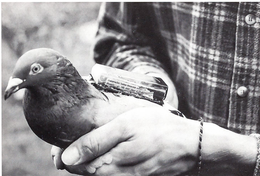
Eine Brieftaube mit aufgeschnalltem Recorder. Sozusagen ein Flugschreiber.