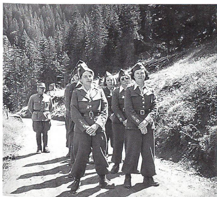
Bereit zum Abmarsch