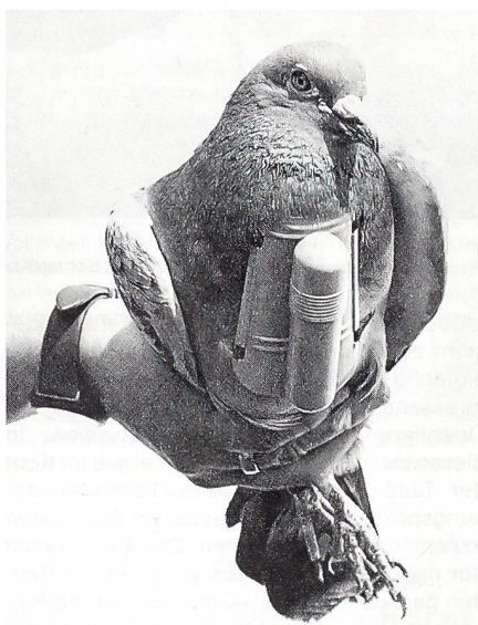
Armeebrieftauben sind aus zweierlei Gründen für die Wissenschaft von besonderem Interesse: Erstens sind sie sehr «pflegeleicht» und zweitens bilden sie eine hochspezialisierte Population mit besonderen Orientierungsfähigkeiten.