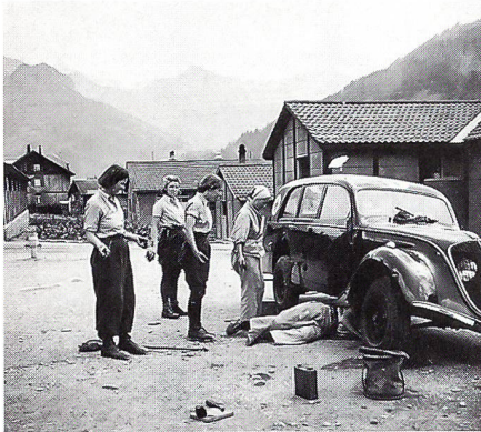
Beim Grossparkdienst am 30. Juli 1943