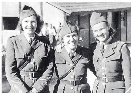
Drei gute Kameraden

Donnerstag, 19. August 1943: KEA Neuordnung der fleischlosen Tage im September. –