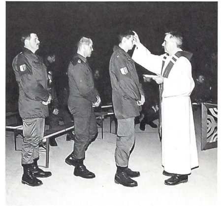
Truppenbetreuung durch den Seelsorger.