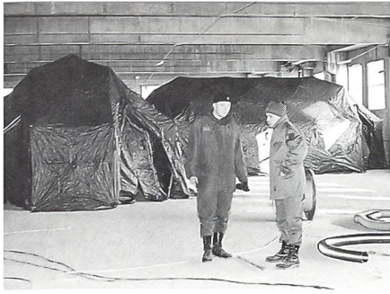
Die ersten 8-Mann-Zelte in der Lagerhalle.

schwemmt werden können, muss man auch auf den Strassen mit Minen rechnen. Das Sicherheitsproblem bewegt aber auch andere Gedanken: Überfälle. Der österreichische Kommandant hat hier einen klaren Standpunkt: Die Sicherheit seiner Soldaten steht an erster Stelle. «Es gibt keine einsamen Wölfe im Transportwesen.» Daher werden im Einsatz immer sechs Fahrzeuge gemeinsam fahren. Eine Sicherung ist immer dabei. Wenn es besonders gefährlich wird, wird eine Eskorte mit Schützenpanzern den Transport begleiten.