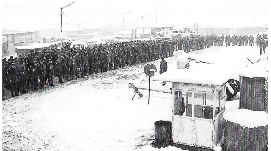
Das angetretene Kontingent unter den frostigen Balkan-Bedingungen.

Aus Sicherheitsgründen wählte man eine aufgeschlossene mehrstöckige Fabrikhalle als Lager. Ein starkes Betondach über dem Kopf und ein trockener Boden unter den Füßen helfen schützen: 6000 Quadratmeter Rohbeton ohne Anstrich. Zur Staubvermeidung wurde der Boden mit einem Plastikbelag überzogen. In der Mitte der Lagerhalle ein 20×20 Meter grosses Loch, durch Planken abgesichert. Beim Beziehen wurde hier ein Aufzug von den Österreichern montiert, da anders das Gerät nicht in den zweiten Stock zu bekommen war. Die Soldaten haben ihr Lager häuslich eingerichtet, obwohl die Umgebung alles an-