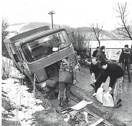
Von der rutschigen Fahrbahn abgekommen: schlechte Verkehrsbedingungen.