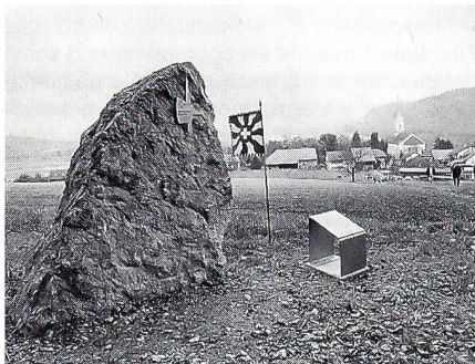
Die Gedenkstätte der Gz Br 5 am Waldrand oberhalb der Kirche Rein.

Rechtsstaat, wir sind ein Arbeitsplatz, wir sind dem sozialen und ökologischen Gedanken verpflichtet. Die Behauptung unserer Unabhängigkeit ist ein zentraler Wert unserer Rechts- und Wertordnung. Wer hier vorbeigeht, der soll an diese Realität erinnert werden.»