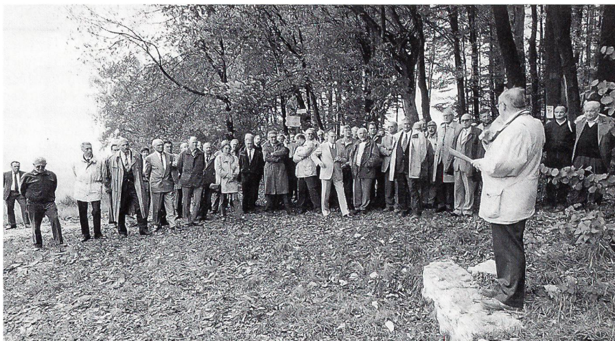
Ständerat und Brigadier Hans Jörg Huber (rechts) bei seiner Ansprache vor den Mitgliedern vom «Verein ehemaliger Offiziere Grenzbrigade 5».

In einer pointierten Ansprache wies Ständerat und Brigadier Hans Jörg Huber, von 1982 bis 1987 Kommandant der Gz Br 5, auf die Überlegung hin, die zur Standortwahl der Gedenkstätte führte, die dazu anregen soll, des gemeinsamen Dienstes aller Brigadeangehörigen am Land im Rahmen der Landesverteidigung seit 1938 bis 1994 zu gedenken. Im Milizsystem sei in der Gz Br 5 an entscheidender Stelle des strategischen Raumes «Schweiz» über Generationen hinweg Jahr für Jahr gewaltige Arbeit geleistet worden, sagte Huber. Und hier werde daran erinnert, dass im Sinne der Freiheit und der Solidarität Verzicht auf Bequemes, Rentableres erfolgten: Im Dienst am Land und für das Land. Dieser Verzicht auf Bequemes, dieses in die Tat umgesetzte Bekenntnis zur Heimat hätten in kalten und heissen Kriegen um uns herum den Beitrag geleistet zur unbeschädigten Erhaltung unseres Vaterlandes, resümierte Brigadier Huber und folgerte: «Die Aufgabe der Gz Br 5 kann von ihr nicht mehr erfüllt werden, sie ist anderem operativen und strategischen Denken zum Opfer gefallen. Aber die Aufgabe, den Kampf ab Landesgrenze zu führen, einem Gegner den Zugang zum Mittelland zu verwehren, der bleibt auch heute und in Zukunft.» Und Huber weiter: «Schliesslich will unsere Gedenkstätte hier in diesem Raum für den Gedanken Zeugnis ablegen, dass Landesverteidigung für die Schweiz, für den Bundesstaat, für die Gesellschaft, die ihn trägt, eine zentrale Aufgabe ist. Wir sind ein