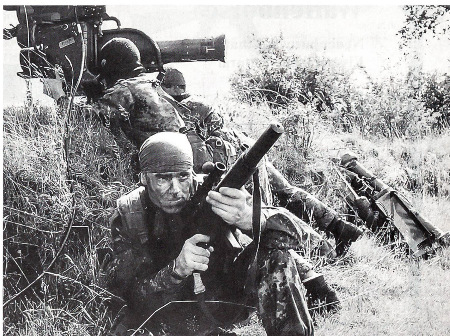
Ein Kampfschwimmer-Team liegt mit einer MILAN-Panzerabwehrrakete auf der Lauer.

Mit diesem Spektrum sind generelle Aufklärungseinsätze in Hafenanlagen, Vorstrand-erkundungen, Einsätze im rückwärtigen Raum sowie Missionen für die Vorbereitung