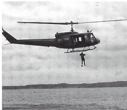
Abrung eines Kampfschwimmers aus einer Bell UH-1 D.

fisch», welches die Einheit 1972 erhielt, spiegelt den Einsatzraum der Sondergruppe wider: Sägefisch (Wasser), Fallschirm (Luft) und Eichenlaub (Land). Das laufende Personal-Exchange-Programm (PEP) mit dem Navy SEAL TEAM TWO der US-Navy begann 1975. In den vergangenen fünf Jahren versah die Kampfschwimmerkompanie verschiedene «scharfe» Einsätze. So z.B. den Schutz des deutschen Minenabwehrverbandes vor terroristischen Anschlägen im Mittelmeer während der Operation Südflanke 1990/91, den Minenräumeinsatz im Persischen Golf nach Desert Storm (1991), die Beteiligung an der Giftgasbeseitigung der UNO (1992–1994) oder die noch laufende aktive Beteiligung im Zusammenhang mit der UNO-Überwachung des UNO-See-Embargos gegen Restjugoslawien in der Adria. Den neuen Anforderungen wurde durch die Gründung der Waffentauchergruppe im Oktober 1991 teilweise Rechnung getragen, indem der Spezialeinheit eine neue interne Struktur gegeben sowie eine Anpassung der Ausrüstung und Ausbildung an das Einsatzkonzept vorgenommen wurde.