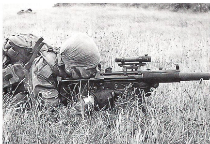
Kampfschwimmer deckt die Infiltration seines Teams mit seiner HK 5 mit Schalldämpfer.

nung, tritt der Bewerber zum Waffentaucher-Grundlehrgang am Anfang des Jahres an.