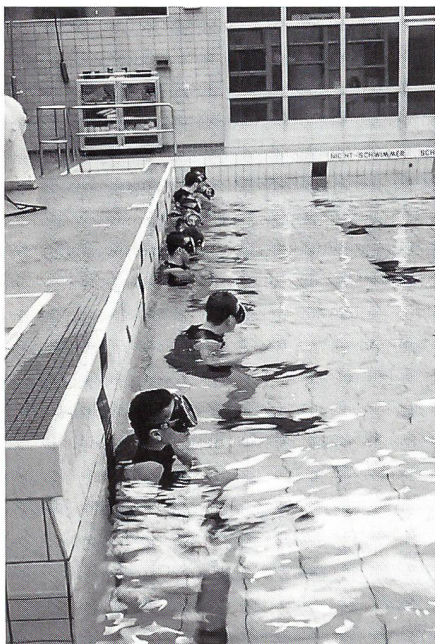
Angehende Kampfschwimmer in der Taucherübungshalle beim Schnorcheln.

Im Jahre 1958 stellte die deutsche Marine die ersten Kleinkampfmittelverbände auf. Die ersten Kampfschwimmer wurden mit Hilfe Frankreichs ausgebildet. Im Sommer des folgenden Jahres konnte der erste Nachkriegs-Ausbildungslehrgang mit Unterstützung durch ehemalige Angehörige der Reichsmarine durchgeführt werden. 1970 bezogen die Kampfschwimmer in der Marinewaffenschule