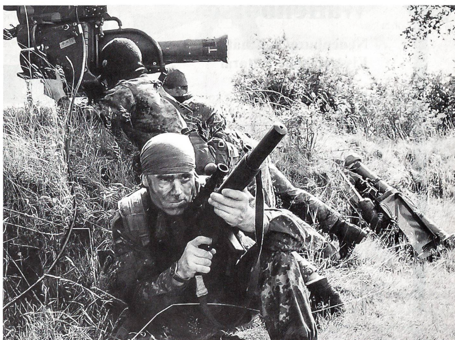
Ein Kampfschwimmer-Team liegt mit einer MILAN-Panzerabwehrrakete auf der Lauer.

Mit diesem Spektrum sind generelle Aufklärungseinsätze in Hafenanlagen, Vorstrand-erkundungen, Einsätze im rückwärtigen Raum sowie Missionen für die Vorbereitung