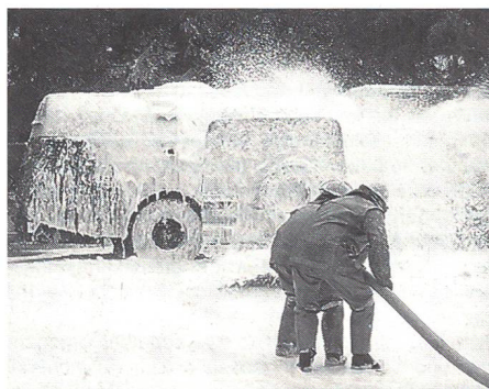
Gestellter Verkehrsunfall – ein Bundes-Feuerwehrgang setzt ein.

In den beiden ersten Jahren «Armee 95» ging es Gall um fünf Bereiche: Einsatzbereitschaft aller Stäbe und Einheiten erreichen, mit einheitlichen Führungsgrundsätzen gutes Betriebsklima schaffen, Erkennen neuer Dimensionen im Rahmen subsidiärer Einsätze, Ausrichten der Ausbildung auf Verbandsleistung, Ausbildungskontrollen nach einheitlichen