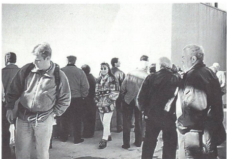
Die Grossbaustelle wird von den Teilnehmern eingehend begutachtet.

Der diesjährige gesellschaftliche Anlass des UOV Andelfingen führte in die Ostschweiz auf den St. Galler Hausberg Säntis. Nachdem die Reisegesellschaft am frühen Morgen das neblige Weinland verlassen hatte, führte die Fahrt über Gossau und