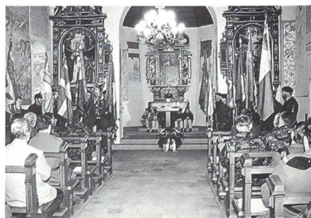
Gedenkfeier in der Sempacher Schlachtkapelle.