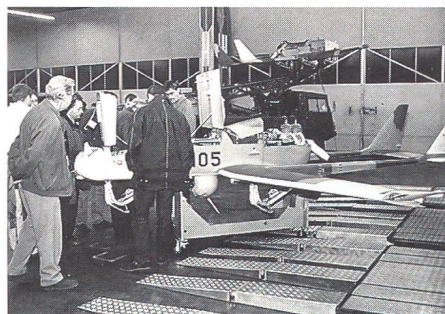
Die Aufklärungsdrohne ADS 95 «Ranger» wird von den Teilnehmern auf Herz und Nieren geprüft und begutachtet.

Die militärischen Aufgaben des Rangers umfassen die Erkundung, Aufklärung und Überwachung. Im