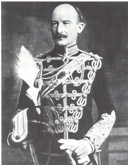
Baden-Powell als junger Offizier der Kavallerie.

Baden-Powell erkannte, dass er Zeit gewinnen musste, damit sich die Kolonialtruppen des Albions im südlichen Afrika sammeln konnten und stark genug wurden, um die Buren entscheidend zu schlagen. Folgedessen wollte Baden-Powell Mafeking möglichst lange verteidigen, indem er eine grosse Stärke vortäuschte und die eigenen Truppen schonte. Die Vorräte und Waffen waren somit aufs äusserste zu strecken und die Leute bei guter Moral zu halten.