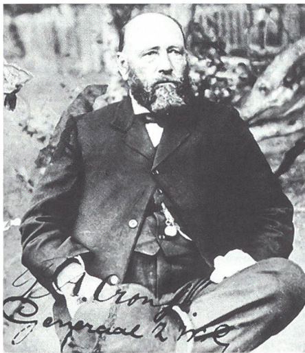
Piet Cronje belagerte Mafeking erfolglos. Später wurde er berühmt als Reitergeneral, der den Briten hartnäckig Widerstand leistete.

Baden-Powell tat alles, um die Moral seiner Truppen und der Zivilisten aufrecht zu erhalten. Er liess «Special Siege Slips» – eine Belagerungszeitung – drucken, welche er geschickt zur psychologischen Kriegführung einsetzte und den Zustand der Verteidiger humorvoll relativierte, während er die burische Kriegführung mit viel Biss der Lächerlichkeit preisgab. Ohne Wissen der Verteidiger wurden die durch die gegnerischen Linien geschmuggelten «Special Siege Slips» in der britischen Presse abgedruckt. «Zur Zeit geht