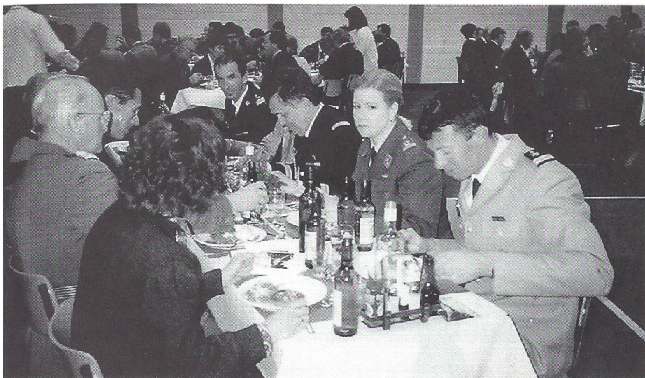
Bankett, Schweizer und ausländische Offiziere mit Begleitung.