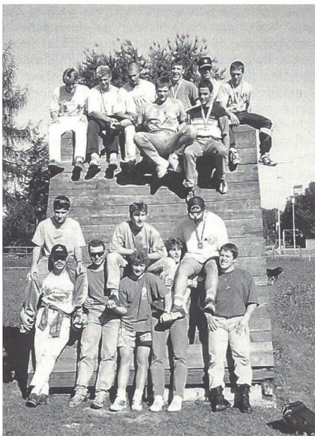
Amriswil 1994: Die fröhliche Interlakner Juniorengruppe nach dem Wettkampf.