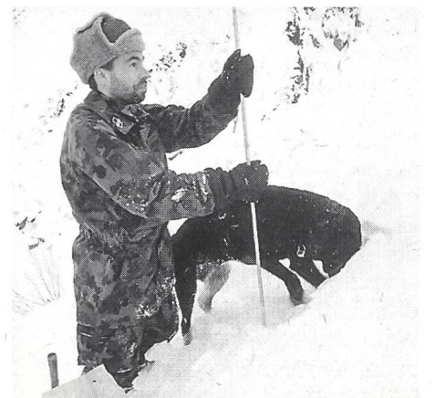
Lawinenrettung: Lawinenhund mit seinem Führer bei der Anzeige einer verschütteten Person.

Wir mussten mit Armee 95 auch in unserem Bereich umdenken, das heisst, wir haben vor allem sehr kurze Ausbildungszeiten, und unser Einsatz ist in Zukunft anders als er bisher