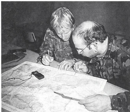
Law Spez bei der Planung einer Begehbarmachung.

Der militärische Lawinendienst ist das Pendant zur zivilen Organisation, dem Schnee- und Lawinenforschungsinstitut Weissfluh-