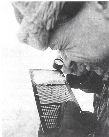
Schneedeckenuntersuchung: Bestimmen von Kornform und Korngrösse mit Raster und Lupe.

Wir machen jährlich einen Ausbildungs-WK, das heisst, wir haben nur eine Kompanie im