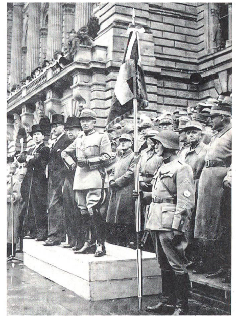
Am Tag der Fahnenehrung nahmen General Guisan, Bundespräsident von Steiger sowie die Bundesräte Kobelt und Celio den Vorbeimarsch der Fahnen ab.

General Guisan gab sein Mandat als Oberbefehlshaber nach ordentlich vollzogener De-