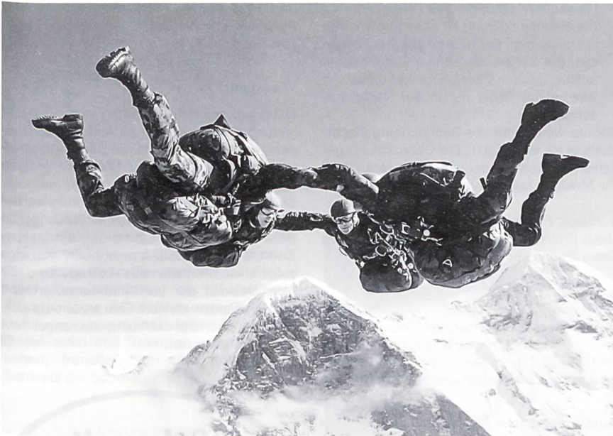
Freifall vor der Eiger-Nordwand.