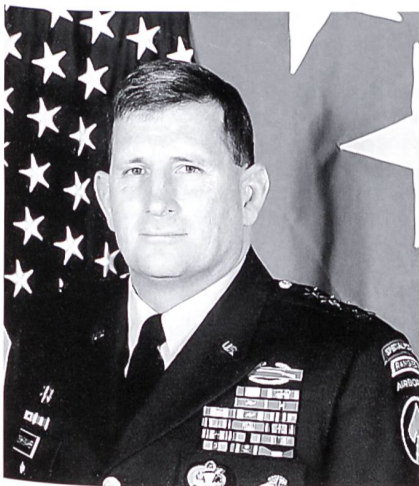
Der derzeitige Kommandant des Special Operations Command, der Viersterngeneral Peter J. Schoomaker, USA, Jahrgang 1946. Der Army-General hat sein Hauptquartier auf der MacDill AFB in Florida.