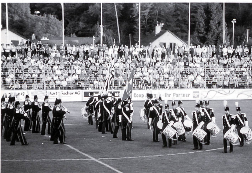
La Landwehr de Fribourg. Das zivile Element an der Rasenshow.

Die Benefizkonzerte gewannen durch die Teilnahme von zwei Militärorchestern aus Skandinavien zusätzlich an Attraktivität. Erstmals waren Orchester aus Finnland und Schweden in der Schweiz zu sehen und zu hören. Diese Orchester vermittelten mit ihrer Musik ein Stück skandinavischer Kultur und nordischer Lebensart. Dabei hätten die beiden Orchester unterschiedlicher nicht sein können. Das Musikkorps der finnischen Luftstreitkräfte war ein kleines Orchester mit rund 30 Berufsmusikern. Dieses Profiorchester, welches in Finnland jährlich zwischen 200 und 300 Konzerte gibt, war sehr vielseitig. An ihren Saalkonzerten zusammen mit dem Rekrutenspiel Aarau spielten sie als kleines Blasorchester vorwiegend finnische Literatur. Bei ihrem letzten Konzert in Buchs AG verwandelte sich das