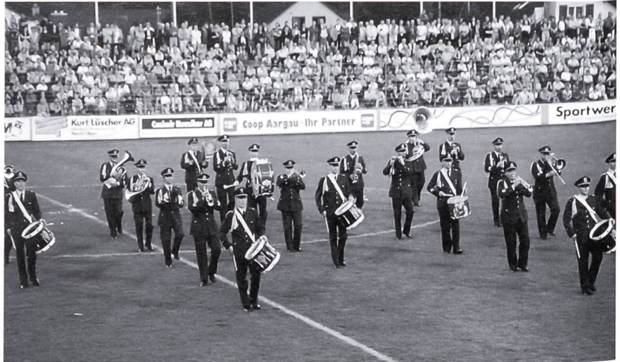
Witzige Showelemente. Das Musikkorps der finnischen Luftstreitkräfte.

Noch nie war die Schweizer Militärmusik mit einer solchen Dichte von Konzerten in der ganzen Schweiz präsent. An 22 Saalkonzerten und einer Rasenshow innerhalb von fünf Tagen beteiligten sich neben den Formationen des Schweizer Armeespiels die Rekrutenspiele von Aarau und Zürich sowie das Stabsmusikkorps des schwedischen Heeres und das Musikkorps der finnischen Luftstreitkräfte. Zudem nahmen an der Rasenshow mit der Landwehr de Fribourg und dem Spiel der Kantonspolizei Aarau auch zwei zivile Orchester teil. Durchwegs volle Konzertsäle waren das Ergebnis einer erfolgreichen Zusammenarbeit zwischen dem Schweizer Ausbildungszentrum Militärmusik mit der Projektgruppe «Mine-Ex» von Rotary sowie den lokalen Rotary-Clubs, welche vor Ort die notwendigen Vorbereitungsarbeiten vornahmen. Da die Organisatoren für die Benefizkonzerte kurzfristig Sponsoren verpflichten konnten, welche sämtliche Kosten der Veranstaltung übernahmen, fliessen sämtliche Einnahmen der Konzerte nach Kambodscha, wo sie der orthopädischen Aktion des internationalen Komitees vom Roten Kreuz in Battambang zukommen.