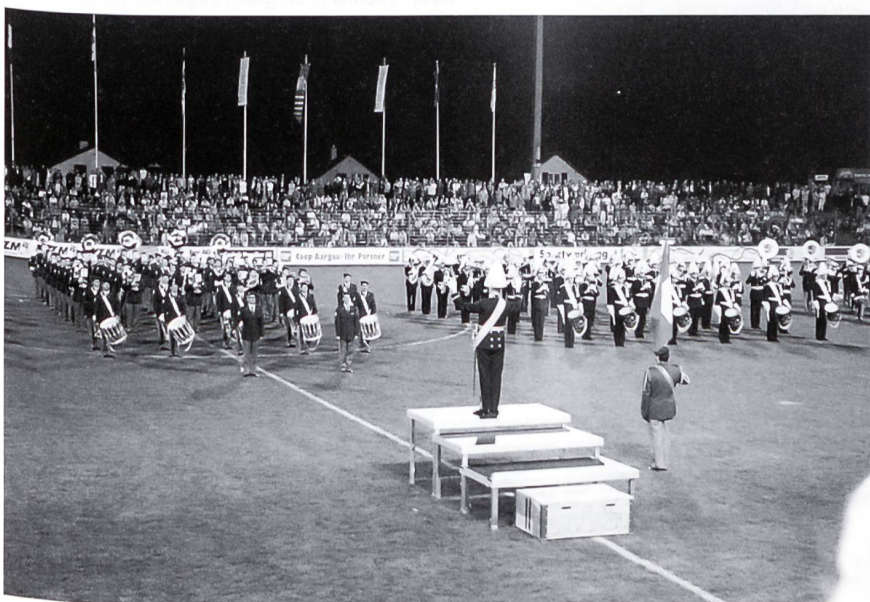
Imposanter Schlussakt. Der schwedische Musikhauptmann dirigiert die Schlusszeremonie im Stadion Brugglifeld.

Cornelius Sommaruga vom Internationalen Komitee vom Roten Kreuz übergeben wurden. Diese Gala bestand aus zwei einzigartigen Konzertabenden: aus einer Brass Night am Freitag, 25. September, und einem symphonischen Abend am Samstag, 26. September. Der Erlös dieser Galakonzerte floss wiederum in das Rotary-Projekt «Mine-Ex». In der Brass Night konzertierten zwei absolute Spitzenformationen der internationalen Brass-Band-Szene. Die Grimethorpe Colliery Band, welche mit dem erfolgreichen Kinofilm «Brassed Off» international bekannt wurde, trat mit der Brass Band des Schweizer Armeespiels auf, welche dieses Jahr in England auf Konzerttournee war und dort die englische Brass-Band-Szene begeisterte. Am symphonischen Abend hatte das Symphonische Blasorchester des Schweizer Armeespiels ein Gemeinschaftskonzert mit einem der weltbesten Kammerensembles, der Camera St. Petersburg, gegeben. ☒