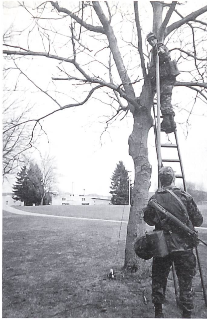
Telefonleitungsbau: Hochbau mit Linienstange.

Versonnen zupfe ich an der Erkennungsmarke. Eine Nummer bin ich hier. Und trotzdem bleibe ich ein Mensch mit eigenem Charakter, lerne verschiedenste Menschen und ihre Eigenarten kennen, erlebe mit ihnen zusammen die Ausbildung und militärische Erziehung in der RS. Leider ist es als Frau gar nicht möglich, die RS wie ein Mann zu erleben, und die Tatsache, dass ich auch noch freiwillig