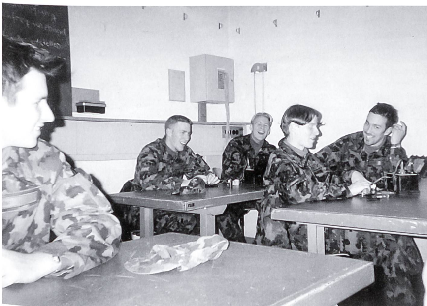
Gelöste Stimmung in der Theoriestunde.

Das Highlight der UOS war jedoch die Übung «Diavolo». Bereits vorweg, es war eher das Gegenteil von Highlight. Wir kamen uns eher als Kampfübermittler vor. Circa 40 km Fahrrad fahren und circa 60 km marschieren. Nun, let's go! Auch wir kamen am Ziel an, auch wenn es nicht immer mit den oben erwähnten Fortbewegungsmitteln war. Mehr möchte ich nicht darüber verlieren, das bleibt unser Geheimnis. Viele waren geplagt vom Wolf und von Blasen. Während den drei Tagen besuchten wir das Festungswachtkorps inklusive Besichtigung und Übernachtung in einem Atomschutzunterstand (darin war es so feucht, man hätte locker eine Dusche geniessen können), Besichtigung des Atomkraftwerks Beznau und eine Fahrt mit den Pontonieren auf der Reuss. Während der Fahrt fragte ich den «Schiffskapitän im Grad eines Rekruten» wie oft er schon Personen transportiert habe. Ich erhielt eine prompte, aber