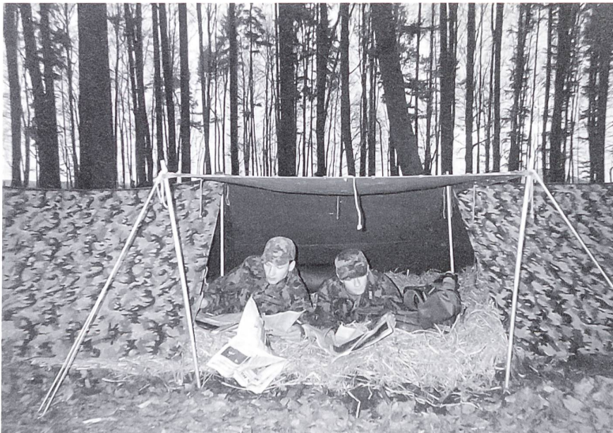
Im Zelt nach getaner Arbeit.

erschreckende Antwort: «Ja, er sei mit uns auf Jungfernfahrt». Zum Glück haben dies nicht alle Leidensgenossen gehört. Zur Beruhigung, es hat kein zweites Titanic-Unglück auf der Reuss gegeben. Nach drei Tagen war die Übung vorbei und wir so müde, dass wir sogar im Stehen einschliefen.