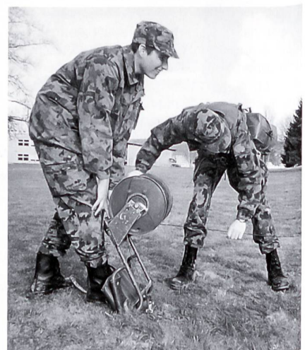
Telefonleitungsbau: Verlegen des Kabels.

Doch vorerst muss noch alles bis zur Perfektion hergerichtet werden: alle Geräte, wie Telefone und Notstromlämpchen, werden schön angeschrieben, Kabel liebevoll verklebt, auch im Schlafrum wird perfekte Ordnung hergestellt, keine persönlichen Utensilien dürfen mehr sichtbar sein... die Individualität wird versteckt, das gilt als Voraussetzung, um als Masse miteinander schnell und geordnet handeln zu können. Das Licht geht plötzlich aus, ich sitze im Dunkeln. Einen Augenblick lang ist es ganz ruhig. Ich taste nach den Streichhölzern und zünde die auf