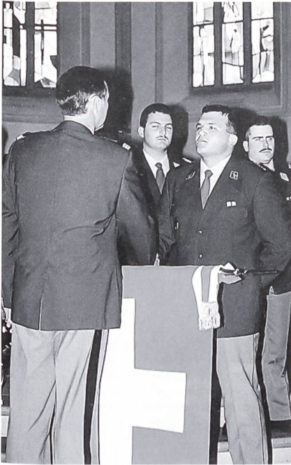
Der Schulkommandant bei der Beförderung.