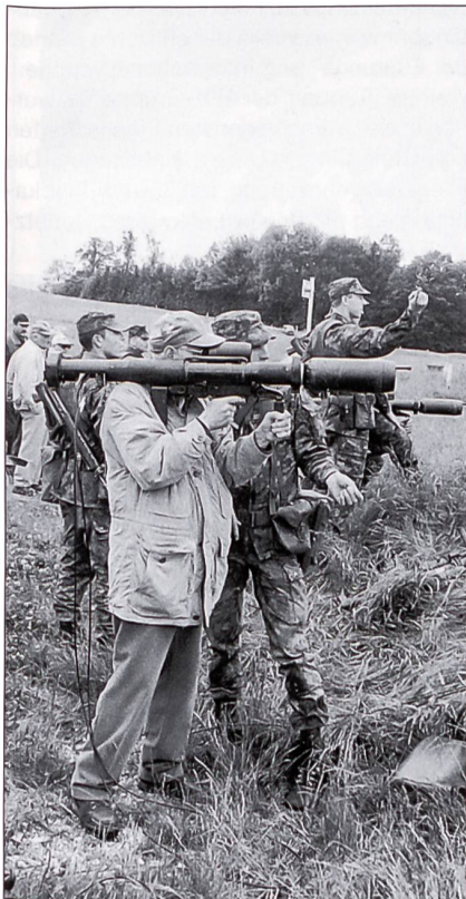
Die Ehemaligen versuchten sich mit der Panzerfaust.

Eine eindrückliche Demonstration boten die Soldaten beim Ortskampf. In Neuchlen-Anschwilen steht eine moderne Häuserkampfanlage zur Verfügung. Erstmals konnten die Soldaten der Gren Kp 31 mit dem Sturmgewehr-Simulator üben. Wie der Kommandant erwähnte, hat dies eine sehr gute Beeinflussung auf das Gefechtsverhalten und die Übungen werden realistisch. Es braucht jetzt keine Schiedsrichter mehr, um festzustellen, wer getroffen ist. Wer «piepst» ist getroffen, und es piepst so lange, bis der Soldat abliegt und liegen bleibt. Erst mit der Schiedsrichter-Pistole wird das Piepsen abgestellt. Im Vergleich zu früher sind die Soldaten viel vorsichtiger beim Stürmen der Häuser, respektive es wird nicht mehr gestürmt, sondern vorsichtig angeschlichen. Dabei muss der Rücken immer gedeckt sein, und der Anschlagwechsel wird geübt. In den Häusern sind in den verschiedenen Räumen automatische Gefechtscheiben aufgestellt. Diese können so eingestellt werden, dass praktisch nonstop geübt werden kann. Wenn ein Soldat bei den ersten Scheiben vorbei ist, stehen die Scheiben wieder auf und der nächste kann sein Training beginnen. Neben den Scheiben werden auch noch Marqueure eingesetzt. Bei einem Angriff auf ein besetztes Haus muss mit bis zu 70 Prozent Verlust gerechnet werden. Das Training hat eine