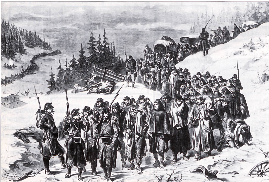
Eskortierung französischer Soldaten durch eidgenössisches Militär im Neuenburger Jura am 2. Februar 1871.

Das in den griechischen Stadtstaaten um 400 vor Christus entstandene System der Demokratie hat in den Innerschweizer