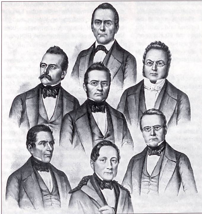
Der erste Bundesrat der Schweizerischen Eidgenossenschaft. Oben: Josef Munzinger, Finanzdepartement; 1. Reihe von links nach rechts: Ulrich Ochsenbein, Militärdepartement, Jonas Furrer, Bundespräsident; Henry Druet, Vizepräsident und Justiz- und Polizeidepartement; 2. Reihe: Stefano Franscini, Departement des Inneren; Friedrich Frey-Hérosé, Volkswirtschaftsdepartement; Wilhelm Matthias Naef, Postdepartement.

Sonderbundskantone verworfen wurde. Sie waren damals nicht bereit, einen Teil ihrer kantonalen Vorrechte an den Bund abzutreten. Interessanterweise hat sich dieses Bild auch bei der Abstimmung über den EWR im Dezember 1992 wiederholt. Die Kantone, welche den EWR-Beitritt mit der höchsten Anzahl Nein-Stimmen verwarfen, waren wiederum – mit Ausnahme des Kantons Fribourg – die Sonderbundskantone.