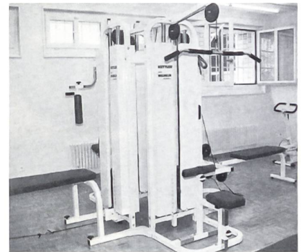
Einmal pro Woche dürfen die Insassen den Fitnessraum benutzen.