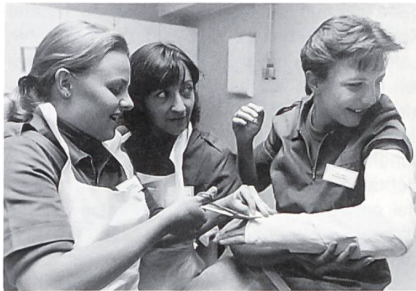
... in der Gipserei

Der Unterricht an der RKD-RS ist ergänzend. Während die Krankenschwestern dem Laienpersonal den korrekten Umgang mit Spritzen und Infusionen beibringen, werden sie selbst darin ausgebildet, andere anzuleiten und zu schulen. Sie lernen nicht nur den normalen Spitalalltag kennen, sondern werden ausge-