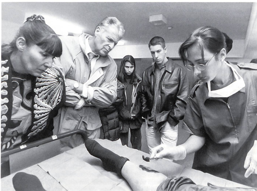
... bei der Wundbehandlung

bildet, wie sie sich in einem Katastrophenfall zu verhalten haben, wo beispielsweise auf Glasspritzen oder anderes wiederverwendbares Material zurückgegriffen werden muss. Einen militärischen Spitalbetrieb, wie er heute geübt wird, erleben die Rekruten im nahe gelegenen Drognens, wo die Wehrmänner der Spitalabteilung 71 einen Gast-WK absolvieren. «Kann man sich dort auch einteilen lassen?», tönt es begeistert aus den Reihen der Damen. Die Aussicht darauf, das Gelernte anwenden zu können und in die Truppe integriert zu werden, kommt gut an.