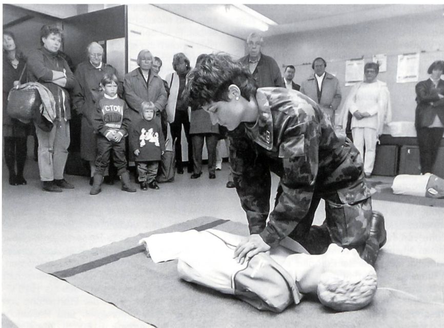
... oder beim Beatmen