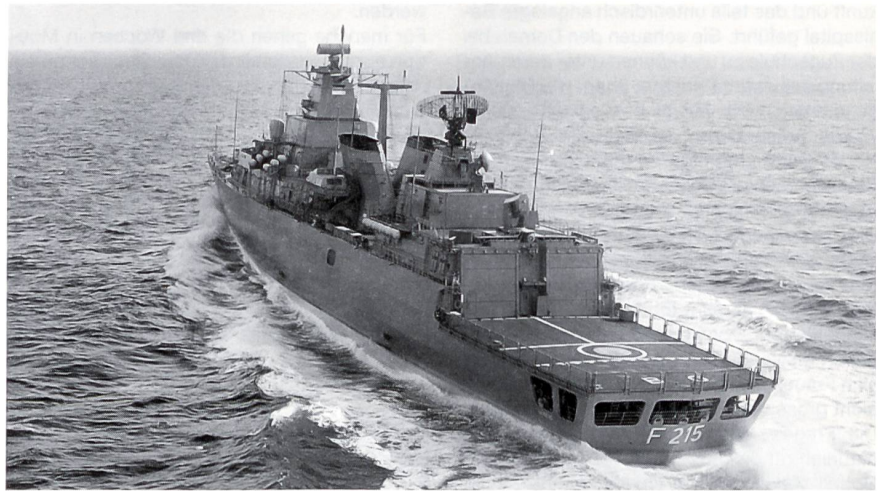
Eine Heckansicht der «Brandenburg». Gut erkennbar sind das Flugdeck und die beiden Hangars für die U-Bootabwehr-Helikopter SEA LYNX Mk 88. Der gespaltene Schornstein reduziert die Ortungsgefahr, weil die heissen Abgase der Gasturbinen verteilt werden.

geht es auch um volkswirtschaftliche Aspekte, da sowohl Beschäftigung wie auch das Know-how in der Werftindustrie nicht geopfert werden sollten.