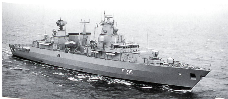
Das Leitschiff der Fregatte Typ 123, die «Brandenburg». Auf dem Vorschiff sind der 76-mm-Geschützturm und ein RAM-See-Luft-Raketenwerfer installiert. Unmittelbar hinter dem RAM-Werfer und der Kommandobrücke sind die Startschächte für die See-Luft-Lenk Waffen SEA SPARROW erkennbar. Auffallend ist die hochgezogene Rumpfwand der Fregatte, die auch auf eine gute Hochseetauglichkeit hinweist.