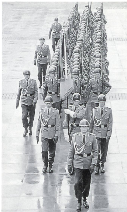
Ehrenkompanie (Heer) des WachBtl BMVg mit Truppenfahne, um 1970.

Mit der Wahl Berlins zur neuen Hauptstadt des wiedervereinigten Deutschland ergab und ergibt sich für das WachBtl BMVg in zunehmendem Masse eine Verlagerung des Schauplatzes seiner Auftritte. Das ehemalige französische «Quartier Napoleon», Anfang 1995 in Julius-Leber-Kaserne umbenannt, dient daher heute der 2. und 7. Kompanie sowie deren Versorgungsanteilgruppe (Stabs-trupp und Versorgungsdienste) als neuer Standort. Die anderen Einheiten und der Bataillonsstab befinden sich nach wie vor in Siegburg. Am 2. Juli 1994 hatte die «Berliner Morgenpost» gemeldet («Wachbataillon und Stabsmusikkorps kommen – keine Kampfverbände»): «Rund 80 Hektar, 178 Gebäude – darunter Sportanlagen, eine Bank, Post und Krankenhaus sowie Offizierskasino und Kantinen – umfasst das Quartier Napoleon am Nordostrand des Flughafens Tegel: Ursprünglich war die bislang von den Franzosen genutzte Kaserne zur Zwischennutzung durch das Auswärtige Amt vorgesehen. Nun soll das traditionsreiche Bonner Wachbatail-