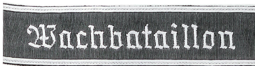
Das Ärmelband «Wachbataillon», gestiftet 1963, wird beidseitig am Waffenrock und am Mantel getragen.