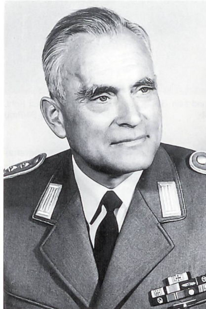
1957 hatte Oberstleutnant Erwin Koch (1916–1987), hier im Range eines Obersten, als erster Kommandeur das WachBtl BMVg übernommen. Die Ordensschnalle weist ihn als Träger des Ritterkreuzes des Eisernen Kreuzes und als Offizier der französischen Ehrenlegion aus.

In der Ausgabe vom 13./14. Dezember 1969 berichtete der «General-Anzeiger für Bonn und Umgebung» («Zwischen Protokoll und Gefechtsdienst – Das Bonner Wachbataillon»): «Im Oktober des Jahres 1954 befand sich die Diskussion darüber, ob die Bundeswehr – wie ihre Vorgängerin, die Wehrmacht – wieder einen protokollarischen Ehrendienst erhalten solle, auf dem Höhepunkt. Die Auseinandersetzung wurde mit aller Heftigkeit, zuweilen sogar mit grosser Bitternis, geführt. Dies um so mehr, als damit auch die Grund-satzfrage nach der deutschen Wiederauf-