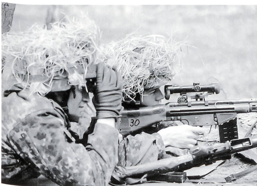
Angehörige der 3. Kp/WachBtl BMVg am G3 während der Gefechtsausbildung auf dem Truppenübungsplatz Daaden.

Mit dem Befehl Nr. 40 vom 16. Februar 1957 kam es schliesslich zur Aufstellung des WachBtl BMVg. Innerdeutsches Pendant dazu bildete das 1956 aus der kasernierten Volkspolizei hervorgegangene Wachregiment der Nationalen Volksarmee (NVA), zuletzt bekannt als «Wachregiment Friedrich Engels». Dessen Grosser Wachaufzug vor der Neuen Wache, seinerzeit «Mahnmal für die Opfer des Faschismus und Militarismus», Unter den Linden, war bis zur Auflösung der NVA Woche für Woche Ostberlins Publikumsmagnet. Das WachBtl BMVg bestand zunächst aus dem Stab, einer Stabs- und Versorgungskompanie, zwei Wachkompanien (Heer), einer Feldjägerkompanie, einer Fernmeldekompanie sowie einem Lehrmusikkorps. Als erster Standort diente ein von den belgischen