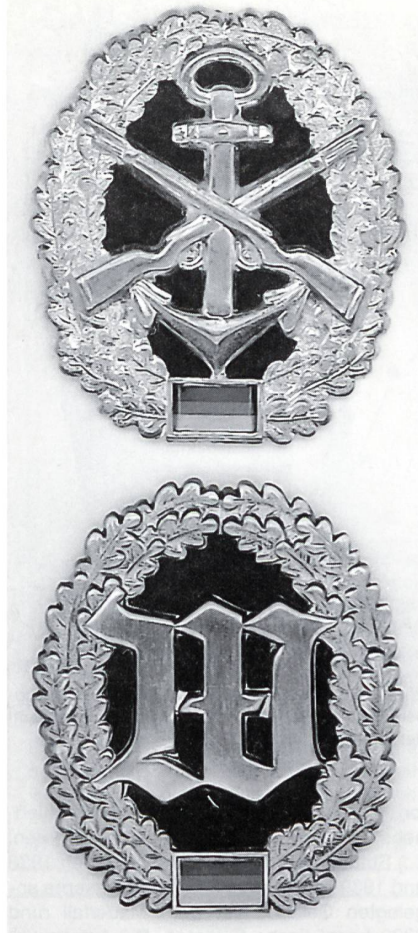
Barettabzeichen des WachBtl BMVG – Marine (oben) und Heer resp. Luftwaffe. Letzteres, eingeführt am 17. November 1978, geht auf die «Wachtruppe Berlin» respektive das «Wachregiment Berlin» der ehemaligen Wehrmacht zurück, welche das gotische «W» auf den Schulterstücken führten.

Und zur Geschichte des «Preussischen Präsentiermarsches» war von der Deutschen Gesellschaft für Militärmusik eV zu erfahren: «Diese Bezeichnung gibt es offiziell nicht. Sie wird im Sprachgebrauch verwendet, vielleicht im Gegensatz zum «Bayerischen Präsentiermarsch». Der Marsch heisst einfach «Präsentiermarsch». Er stammt von Friedrich Wilhelm