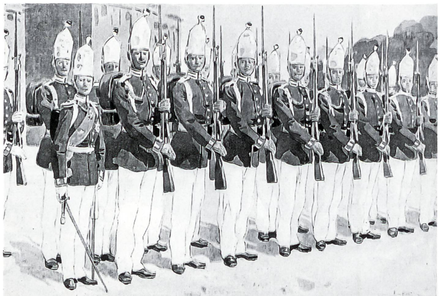
Ehrenkompanie des 1. Garde-Regiments zu Fuss (1. GRzF), vor 1900. Zur Parade wurden die traditionellen Grenadiermützen getragen. Vorne links Kronprinz Wilhelm (1882–1951) als Leutnant. Das WachBtl BMVg führt die Tradition des 1. GRzF. (Becker Carl: Unter den Fahnen – Das deutsche Heer an der Jahrhundertwende)

Die Truppenfahnen der deutschen Bundeswehr, hier die Fahne des WachBtl BMVg, waren am 18. September 1964 durch Bundespräsident Heinrich Lübke gestiftet worden. (Friedel Alois: Symbole – Feldzeichen – Truppenfahnen)