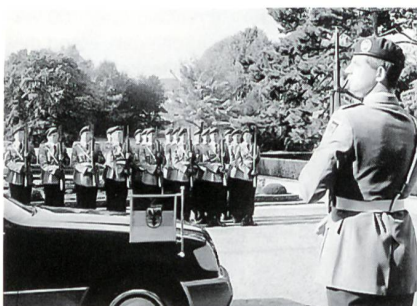
Ehrenzug und Ehrenposten (Heer) des WachBtl BMVg an der Villa Hammerschmidt in Bonn (ehem. Sitz des Bundespräsidenten) anlässlich einer Botschafterakkreditierung.

Ein bedeutendes historisches Ereignis war die gemeinsame deutsch-russische Parade vom 31. August 1994 im Treptower Park anlässlich der Verabschiedung der Westgruppe der russischen Streitkräfte. Und unter dem Titel «Erster Grosser Zapfenstreich der Bundeswehr in Berlin» konnte man am 6. September gleichen Jahres ebenfalls in der «Berliner Morgenpost» lesen: «Zum Grossen Zapfenstreich am Donnerstagabend vor dem Brandenburger Tor treten das Wachbataillon des Verteidigungsministeriums und das Stabsmusikkorps der Bundeswehr an. Die 400 Soldaten werden von Oberstleutnant Stephan Schäfer kommandiert. Dazu stossen je 50 Soldaten der Westalliierten als Abordnungen sowie 50 Mann der 4. Kompanie des Bundeswehr-Jägerbataillons 581. Die Solda-