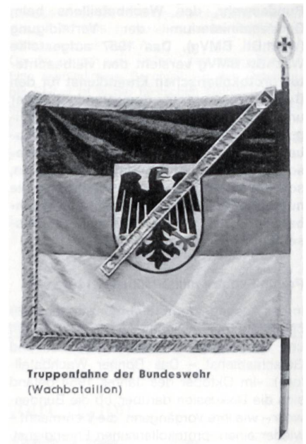
Truppenfahne der Bundeswehr (Wachbataillon)