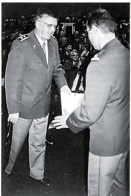
Div Ostertag überreichte jedem Absolventen das Diplom.

Ogi: Schweiz muss auch Frieden produzieren Bundesrat Ogi warb in seiner Ansprache u a um Verständnis für die Armee reform 2000+, die wegen der Änderung der Bedrohungslage, wegen der weiter rückläufigen Bestände und aus finanziellen Gründen nötig werde. Zudem betonte er, dass die Schweiz