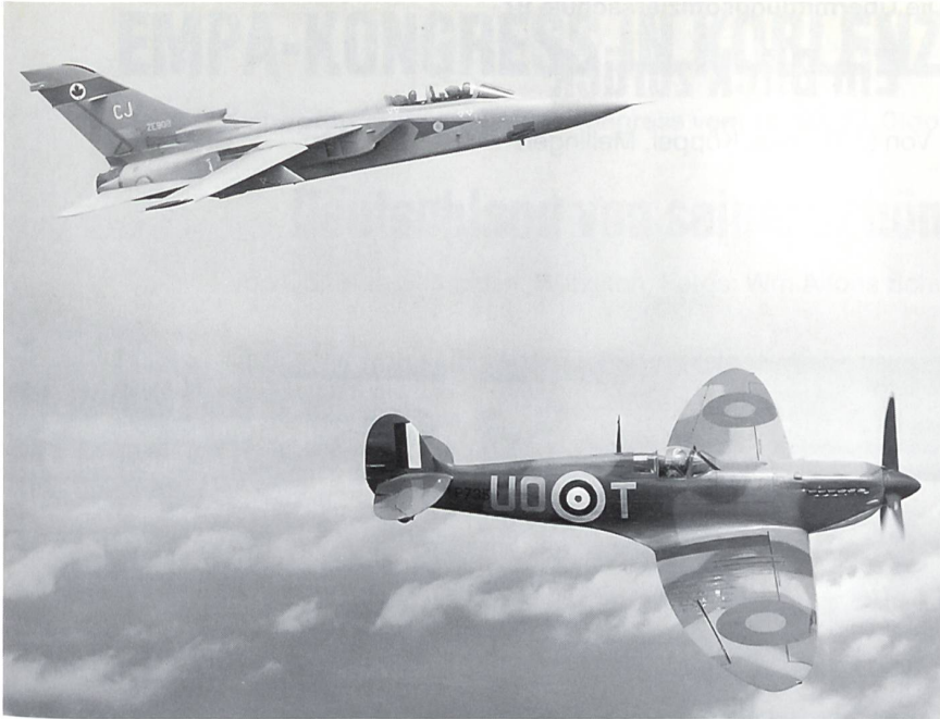
Maschinen von einst und jetzt. Die legendäre «Spitfire» (vorne), die unter anderem auch dank einer besseren Bewaffnung oft über die deutschen Me 109 siegreich blieb, sowie hochmoderne Maschinen der heutigen Royal Air Force, wie diese «Tornado» F3 (hinten) der Number 5 Squadron (Nr 11 Group) vom Luftstützpunkt RAF Coningsby, gehörten zum 166 Flugzeuge zählenden Grossverband, der am 15. 9. 90 zur Erinnerung an den 50. Jahrestag des Sieges über die deutsche Luftwaffe in der Luftschlacht um England über dem Zentrum von London defilierte.

Am 31. 10. 40 war die Luftschlacht offiziell beendet. Die Royal Air Force hatte insgesamt 915, die deutsche Luftwaffe 1733 Flugzeuge verloren.