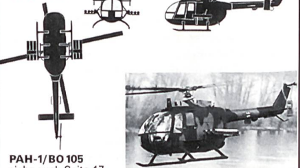
PAH-1/BO 105 siehe auch Seite 47