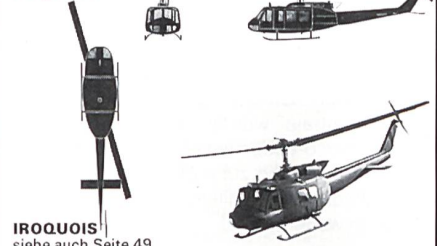
IROQUOIS siehe auch Seite 49