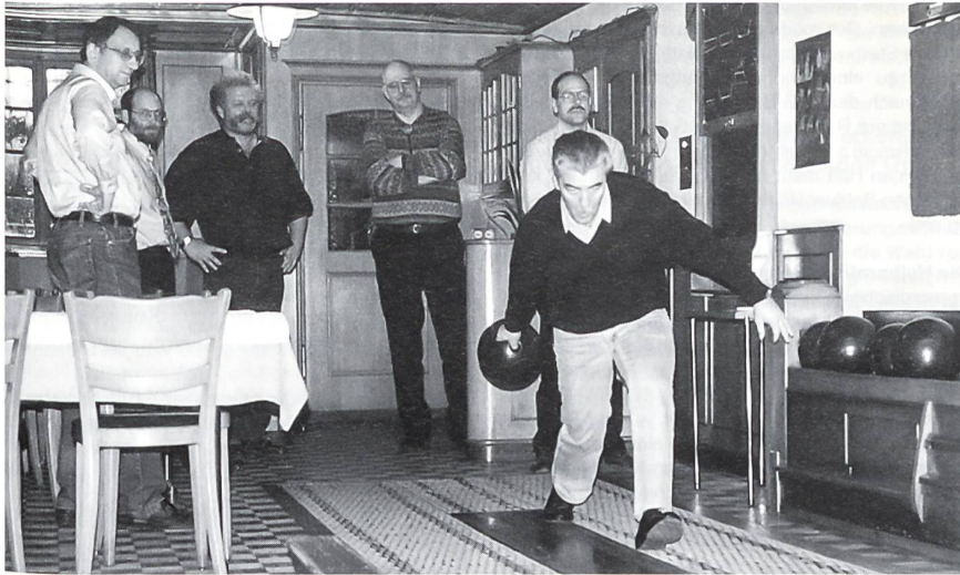
Gut beobachteter Wurf am Kegelabend der Seniorengruppe.

eingeweiht wurden. Mit ihrem eigenen Tätigkeitsprogramm haben die Senioren an verschiedenen Übungen der Aktiven mitgearbeitet. So hat zum Beispiel die Seniorenobmannschaft an der Kaderübung «Sultans of Swing» unter dem Motto «Natur und Kultur» ein flottes Zusatzprogramm mit Begehung der Taminaschlucht und Besichtigung des Schlosses Sargans organisiert.