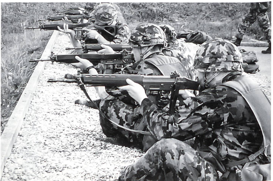
«Neue Gefechtsschiess-technik». Gar nicht so einfach, das Schieszen in sitzender Stellung.