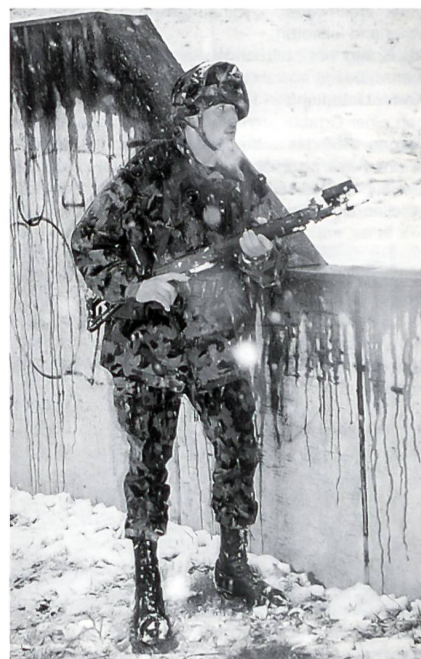
Soldat mit Sturmgewehr-Simulator.

Die Ausbildungsmodulare beim FDK dauerten zwischen einem halben und fünf Tagen. Der gesamte Kurs dauerte 8 Tage. Kurzfristig wurde auf den 20. Januar 1998 eine Medienorientierung angeordnet. Neben den lokalen Medienvertretern wurde mit