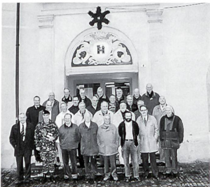
Das Bild zum Jubiläum «Genisten von heute» vor dem Kasernen Eingang von vorgestern, das heisst von 1856.

Als Brugg 1847 offiziell Waffenplatz der Pontoniere wurde, bezog sowohl die Mannschaft wie auch das Kader Unterkunft in Privathäusern. Erst auf Verlangen einer Ortsbürgerversammlung liess der Kanton Aargau 1856 das in der Hofstatt liegende Kornhaus in eine Kaserne umbauen. Im Dachgeschoss dieses Gebäudes, das seit vielen Jahren Domizil der Industriellen Betriebe der Stadt Brugg ist, konnten die