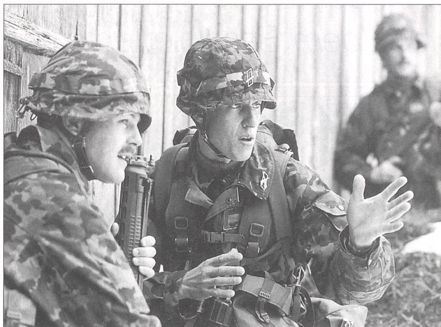
Garantiarbeiten im Bereich der Ausbildung 95: Wann endlich?

Die Wehrgerechtigkeit muss auf jeden Fall erhalten bleiben. Alle Wehrmodelle müssen dahingehend geprüft werden, ob die Rahmenbedingungen für den einzelnen Betroffenen in jeder Dienstform (ob in Armee, Bevölkerungsschutz oder auch im Zivildienst) ein gleiches Mass an Vor- und