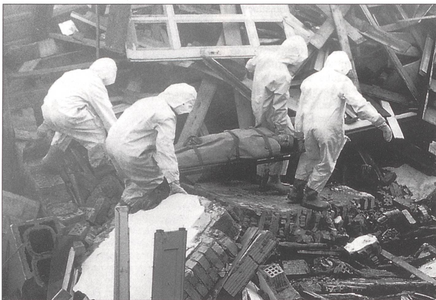
Rettungstruppen während der Ausbildung (Bergungseinsatz)

Den Medien war zu entnehmen, dass eine vorgezogene Teilrevision des Militärgesetzes geprüft wird, um so die Möglichkeit zu schaffen, bewaffnete Einheiten ins Ausland