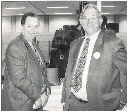
(Von links) Ständerat Hans Uhlmann und Nationalrat Otto Hess (damals noch im Amt) sind begeistert.

erstellt werden. Die zweite Anlage in Bière ist für die kampfwertgesteigerten Panzerhaubitzen vorgesehen. Sie wird ab 2004 zur Verfügung stehen.