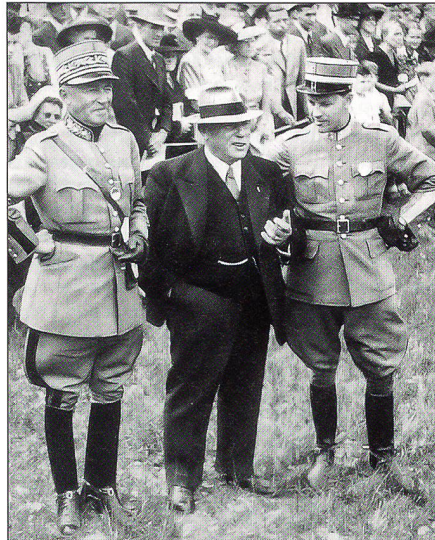
Der General zusammen mit Bundesrat Rudolf Minger

nicht. Aber als ich nach der Generalswahl am 30. August 1939 das Bild des neuen Armeechefs in der Zeitung sah, da erinnerte ich mich an jenen freundlichen Offizier und wusste nun, das war Henri Guisan.