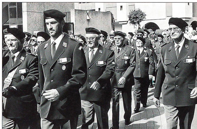
Geschlossener Aufmarsch der Schweizer Delegation an einer internationalen Veranstaltung.

ganisiert. Wenn Sie liebe Leserin, lieber Leser, diesen Bericht aufmerksam studiert haben, könnte das Gefühl aufkommen, diese Wallfahrt bestehe nur aus Gottesdienstbesuchen. Es ist schon so, dass die Gottesdienste einen besonderen Stellenwert haben, da es im Grundsatz ein religiöser Anlass ist. Dass aber die kameradschaftlichen Kontakte nicht zu kurz kommen, darf doch auch erwähnt werden. All die Offiziere, Unteroffiziere und Soldaten in ihren zum Teil farbenfrohen Uniformen, freuen sich auf Kontakte zu Armeen anderer Länder. Viele Freundschaften unter Kameraden und Kameradinnen aus verschiedenen Nationen sind schon entstanden. Besonders diejenigen, welche im Zeltlager logieren, haben sehr gute Möglichkeiten, mit anderen Militärpersonen bleibende Beziehungen aufzubauen. Dazu trägt natür-