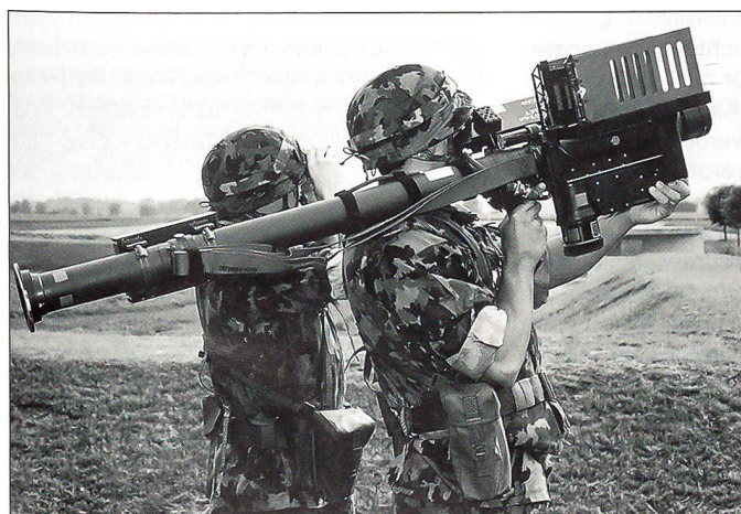
... als Stinger-Team.