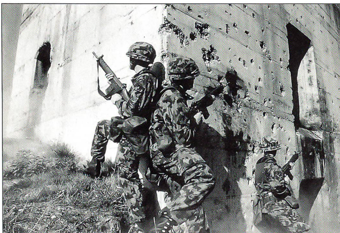
Rekruten bei der Grundausbildung: Füsiliere beim Häuserkampf-Training ...

ihn kein Problem dar. Er ist es gewohnt, nach einer allgemeinen Einführung in ein Thema selbstständig sich Kompetenzen anzueignen und diese im weiteren Arbeitsverlauf einzusetzen. Er erwartet optimal gestaltete Arbeitsplätze und vor allem eine ausgezeichnete Arbeitsplanung. Die militärischen Ausbilder sind gefordert: Sie müssen im Rahmen der Möglichkeiten die selbstständige Arbeitsweise der Auszubildenden fördern und ihre Neugier durch geeignete Methoden und Materialien wecken oder aufrechterhalten. Hierzu müssen technische Hilfsmittel wie CUA oder Simulatoren gezielt eingesetzt werden. Auch das Beiziehen von externen Spezialisten sei hier erwähnt, handle es sich nun um einen Referenten zur Thematik «Sicherheit durch Kooperation» oder eine fachtechnische Unterstützung bei Spezialausbildungen. Im kleineren Rahmen bietet sich auch die