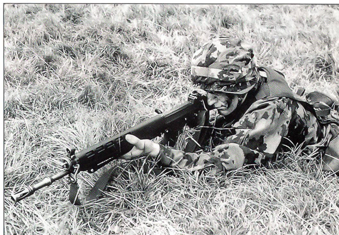
... als Einzelkämpfer,

Junge Leute gehen kritisch durchs Leben. Sie wollen wissen, warum sie was tun müssen. Das Kader ist aufgefordert, den Rekruten vermehrt den Sinn ihres Dienstes zu vermitteln. In einer Zeit, in der die Bedrohungslage schwierig zu verstehen ist, ist es vor allem auf einer allgemeinen Ebene erforderlich, dass die Rekruten einsehen, warum ihr Dienst notwendig ist. Aber auch im Alltag muss man ihnen beispielsweise erklären, warum die Zimmerordnung wichtig ist, warum sie die Manipulationen am Sturmgewehr drillmässig einüben müssen oder warum sie nach einer Nachtübung nur drei Stunden schlafen können und dann die Ausbildung am nächsten Tag normal weitergeht. Jeder Befehl muss einen Sinn haben. Vor allem zu Beginn der soldatischen Ausbildung ist es oft notwendig, diesen Sinn zu erklären. Nur so kann sichergestellt werden, dass die Soldaten zu einem späteren Zeitpunkt ihren Vorgesetzten vertrauen und die Aufträge auch dann pflichtbewusst erfüllen, wenn mit knapp gehaltenen Befehlen geführt werden muss. Das heisst, dass insbeson-