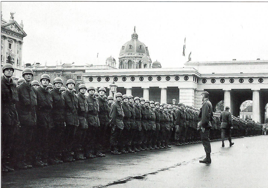
Zur feierlichen Angelobung bereit.

reich.» Auch Bundesminister Werner Fasslabend äusserte ähnliche Worte: «Wir wollen den Nationalfeiertag mit Stolz auf die Leistungen unserer Soldaten begehen.» Da kann schon ein wenig Neid aufkommen, solche Worte würde ich auch in der Schweiz wieder einmal gerne hören.