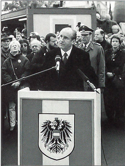
Bundespräsident Thomas Klestil