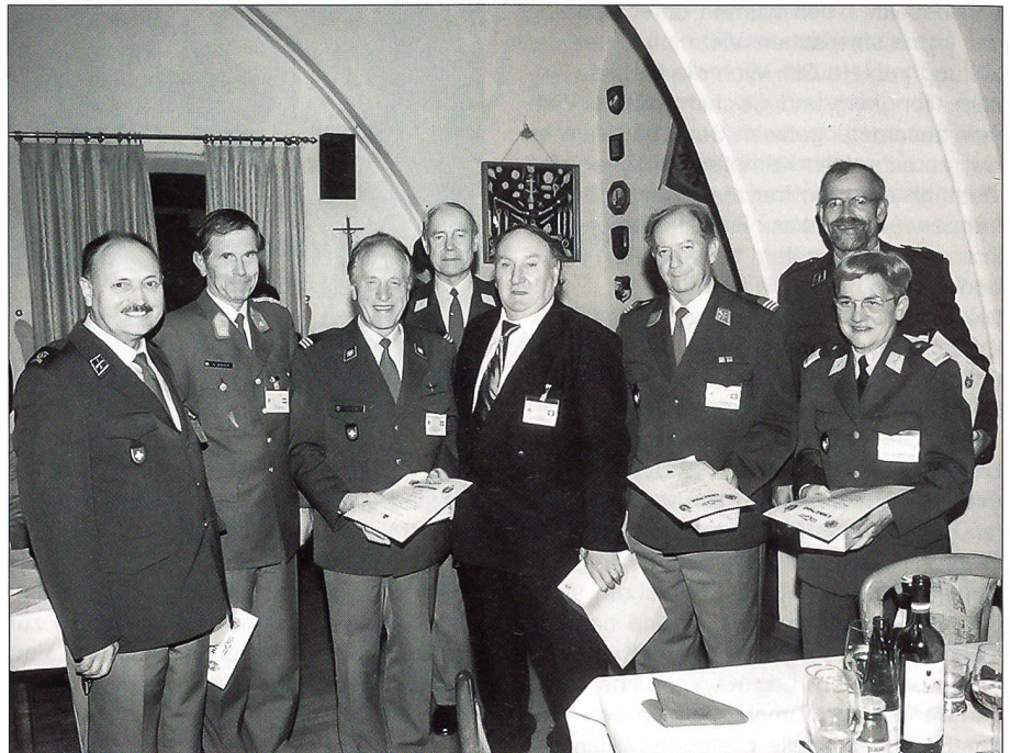
Ein Teil der Schweizer Delegation von Brigadegeneral Dr. Horst Mäder mit einem Erinnerungsbecher beschenkt.

Nach der offiziellen Eröffnung des Kongresses wurde nach Eisenstadt nahe der ungarischen Grenze verschoben, und der Assistenzeinsatz konnte vor Ort besichtigt werden. Es war schon ein ganz spezielles Gefühl, an dem Ort an der Grenze zu stehen, wo erstmals DDR-Bürger kurz vor dem Mauerfall in den Westen gekommen