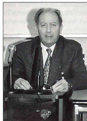
Der Chefredaktor des «Schweizer Soldat» und neuer zweiter Vizepräsident erläutert das Konzept der EMPA Schweiz betreffend Reformen für die EMPA.