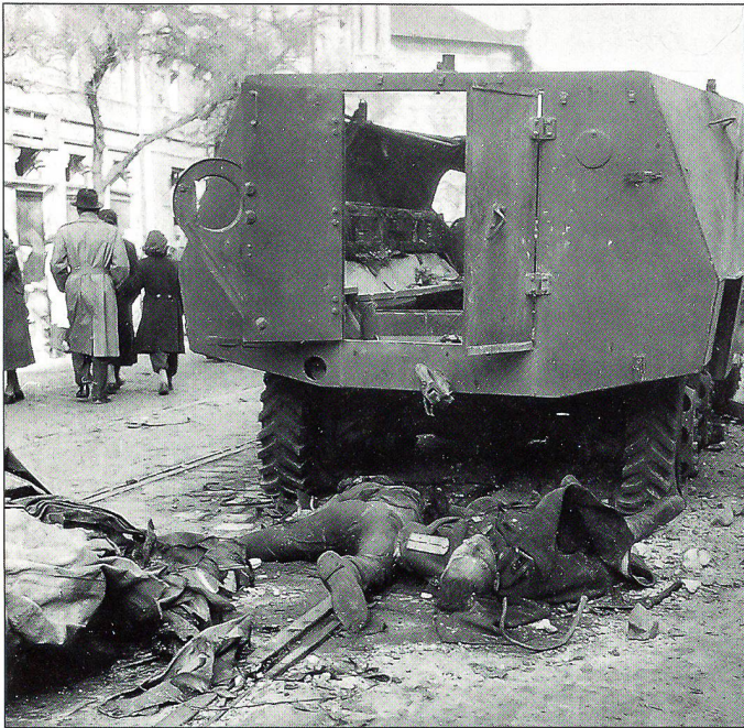
Budapest, Ende Oktober 1956 – Durch Freiheitskämpfer zerstörter sowjetischer Schützenpanzer und dessen verbrannte Besatzung.