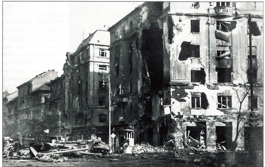
Ende Oktober 1956 – Barrikaden und Ruinen an einem Budapester Boulevard.