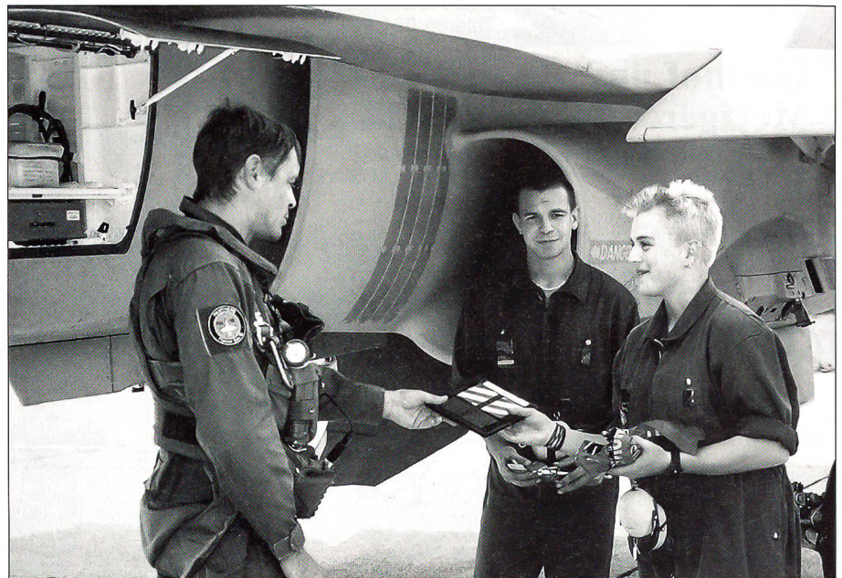
Die beiden Flugzeugwarte werden vom Piloten informiert.

Bei Katastrophenlagen und in Krisenzeiten dient der Waffenplatz Moudon auch als