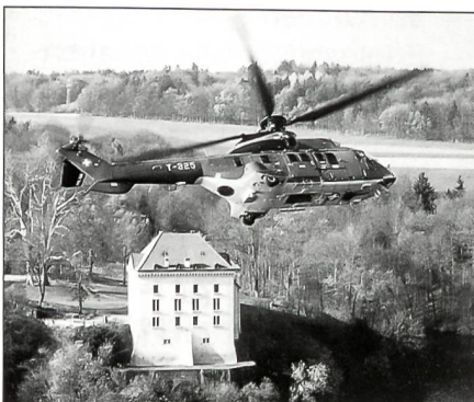
Am Flugmeeting können unter anderem bestaunt werden: Vorführungen des Super Puma ...

Das Flugfestival Dübendorf 2000 will den Kontakt zur Bevölkerung festigen. Wir wollen zeigen, wie viele Berufe und Berufsparten direkt oder indirekt mit der Fliegerei verbunden sind. Wir möchten den Jungen eine Hilfe zur Berufswahl bieten und ihnen die Möglichkeiten in der Aviatik aufzeigen.