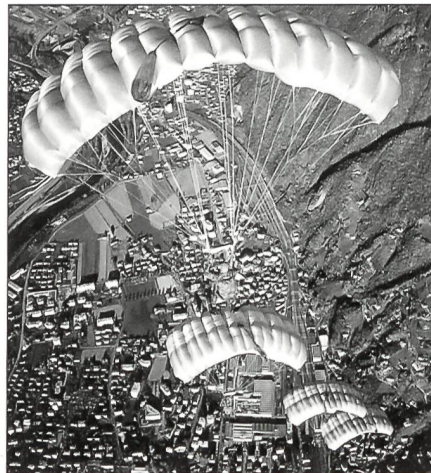
... der Fallschirmspringer ...