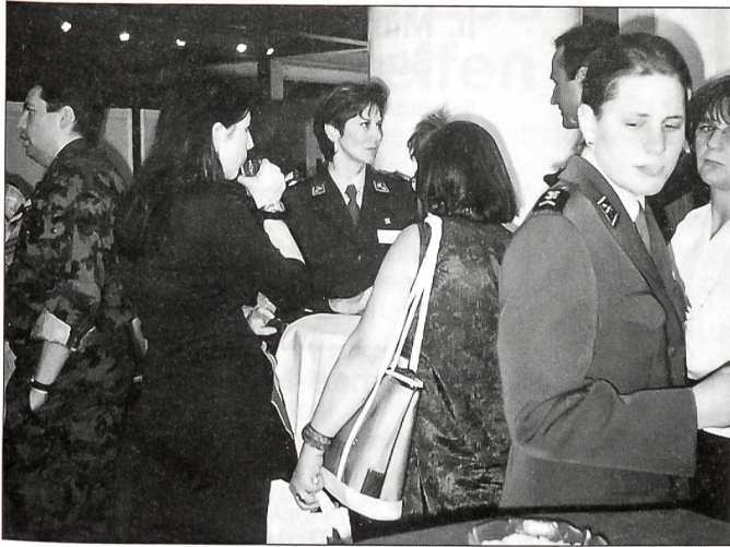
Der Apéro wurde für interessante Gespräche genutzt.