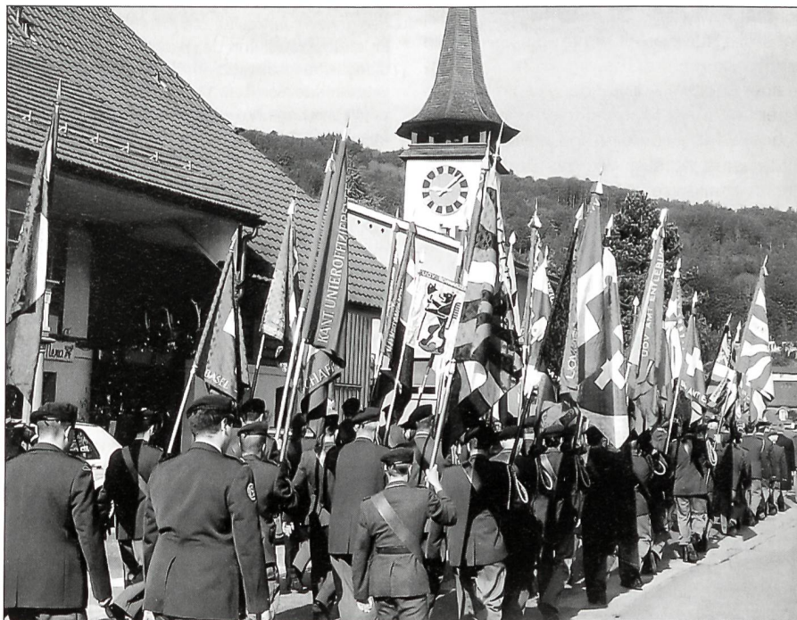
Farbenprächtiger Umzug durch Belp.

Um 08.45 Uhr versammelten sich die Delegierten, allen voran die Fahnenräger, am Bahnhof Belp zum Abmarsch zum