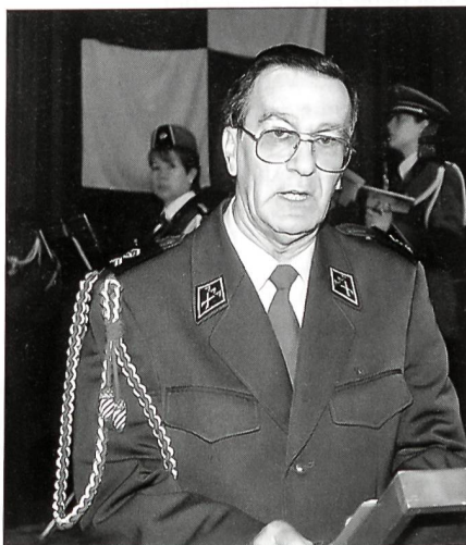
Zentralpräsident Adj Uof Alfons Cadario.

Zentralpräsident Adj Uof Alfons Cadario erwähnte in seinem Begrüssungswort die wichtigen Ziele der Reform Armee XXI. Für die Arbeitsgruppe der Unteroffiziere muss diese Reform die Glaubwürdigkeit nach innen und aussen zurückgewinnen durch eine qualitativ hochstehende Ausbildung des direkten Vorgesetzten der Mannschaft, eine Aufwertung des Stellenwertes des Gruppenführers und einer Attraktivitätssteigerung der Unteroffizierslaufbahn. Er betonte, dass die Glaubwürdigkeit der Armee