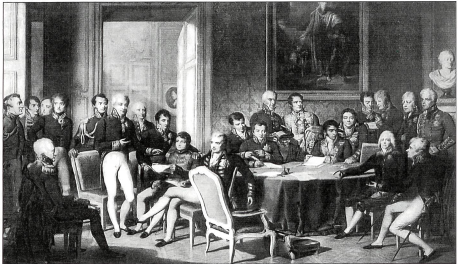
Die leitenden Staatsmänner Europas beraten auf dem Wiener Kongress über die politische Neuordnung.

Das Eidgenössische Defensionale, definitiv