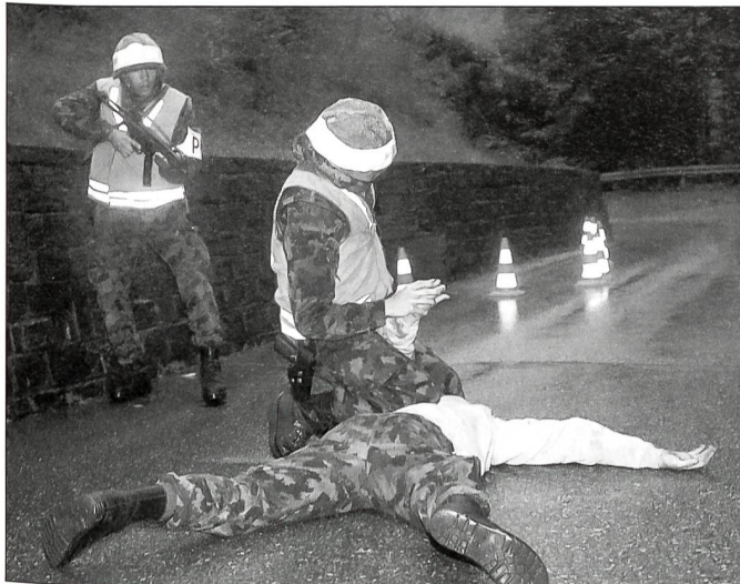
Festnahmen von Personen werden durch die MP-Grenadiere professionell durchgeführt.

die Leute nachher ihren Dienst leisten, dient.