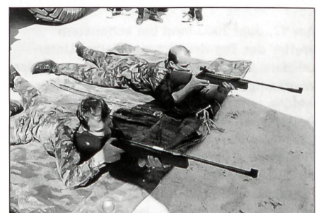
Das Luftgewehrschiessen erfordert eine ruhige Hand und ein gutes Auge.