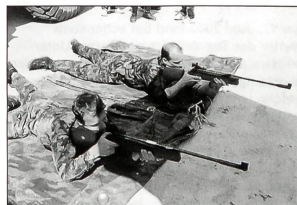
Das Luftgewehrschiessen erfordert eine ruhige Hand und ein gutes Auge.