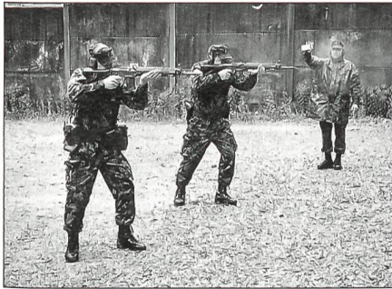
Die Neue Gefechtsschiesstechnik verlangt vom Schützen perfekte Beherrschung der Waffe und schnelle Reaktionen.