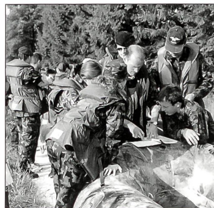
Der Fragebogen scheint dieser Mannschaft einiges Kopfzerbrechen zu bereiten.

An der vorbezeichneten Stelle galt es, möglichst direkt und schnell die Reuss zweimal zu queren. Diese Aufgabe stellte hohe Anforderungen an die Teamkoordination, die Führungsqualitäten des Bootschefs und die Kondition der Wett- kämpfer. Bereits um 10 Uhr erreichte das erste Boot das Fahrtziel, die Lorzemündung in Ma- schwanden. Geschicklichkeit und Allgemeinwis- sen wurden in den folgenden Disziplinen ver-