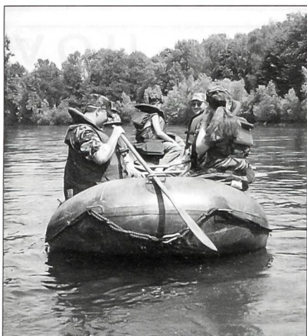
Unterwegs auf der Reuss in einer wunderschönen Landschaft.

langt. Ein Velocross mit Armeefahrrädern, Luftgewehr-schiessen, Zielwurf mit Übungswurfkörpern und ein anspruchsvoller Sanitätsdienstparcours rundeten den Wettkampf ab.