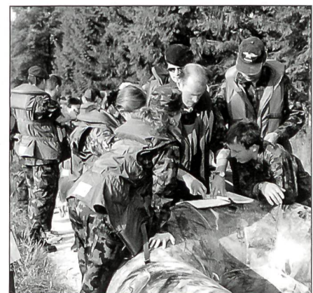
Der Fragebogen scheint dieser Mannschaft einiges Kopfzerbrechen zu bereiten.

An der vorbezeichneten Stelle galt es, möglichst direkt und schnell die Reuss zweimal zu queren. Diese Aufgabe stellte hohe Anforderungen an die Teamkoordination, die Führungsqualitäten des Bootschefs und die Kondition der Wettkämpfer. Bereits um 10 Uhr erreichte das erste Boot das Fahrtziel, die Lorzemündung in Mäschwanden. Geschicklichkeit und Allgemeinwissen wurden in den folgenden Disziplinen ver-