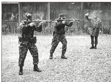
Die Neue Gefechtsschiesstechnik verlangt vom Schützen perfekte Beherrschung der Waffe und schnelle Reaktionen.