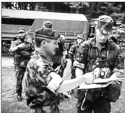
Befehlsausgabe für den Kompass-Lauf.

Aller Anfang ist schwer, doch sah man eine Qualitätssteigerung im Laufe der Lektionen.