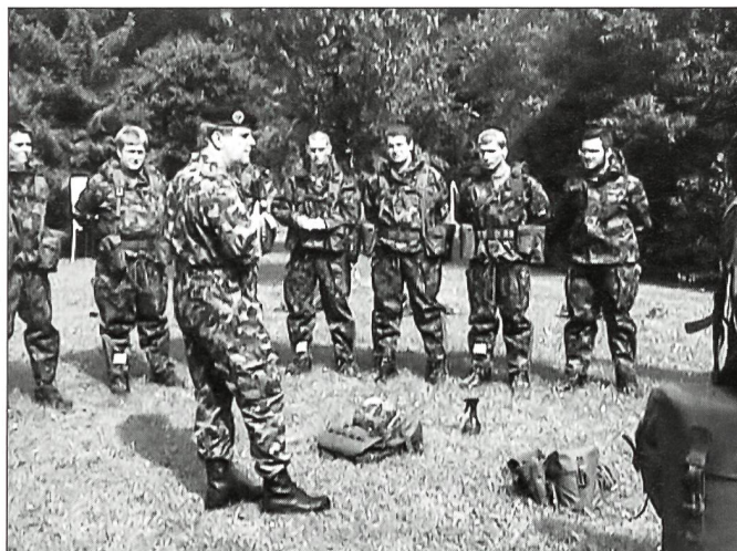
Theorie im Freien.

Die wichtigste Aufgabe und den Hauptanteil am guten Gelingen der vergangenen Schule leisteten sicher die Klassenlehrer. Nicht zuletzt ihrem Können und ihrem Einsatz ist es zu verdanken, dass der Schulkommandant am Ende der Unteroffiziersschule 38 Uof-Anwärter im Wissen brevetieren konnte, dass sie auf ihre zukünftige Aufgabe gut vorbereitet und mit dem Rüst-