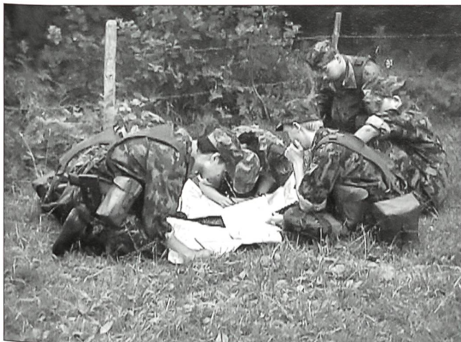
Gemeinsam trägt die Gruppe den nächsten Posten auf der Karte ein.

Eine weitere Übung stand uns in dieser Woche noch bevor: «ULTIMO»: In dieser Übung wurde die Führungsanwendung, das Teamwork, das Organisieren in der Gruppe wie auch das Kartenlesen gefordert. Natürlich ging es auch um die Kameradschaft und nicht zuletzt um die herrliche Sommermarschrouten im Gebiet Moléson FR.