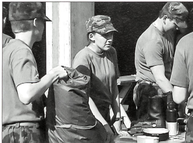
Material wird gefasst.

Trotz der dichten Unterrichtsstruktur kommt aber auch die Freizeit spürbarer zum Zug; als zukünftiges Kadermitglied hat man schon deutlich mehr Freiheiten als auch schon. Auch die in der RS oft gefor-