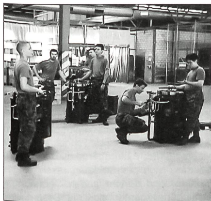
Instruktion bei der Geräteübergabe.

Lustig zu beobachten waren die durch und durch begeisterten Jugendlichen, welche sich am Montag, den 12.7. vor dem Waffenplatz einfanden, um voller Elan ihre Rekrutenschule zu beginnen. Ich muss zugeben, einige von uns waren doch etwas schadenfreudig, da bei den meisten die RS auch noch nicht lange zurücklag. Die dritte Woche stand unter dem Zeichen der Übung PROBATUM, in welcher es da-