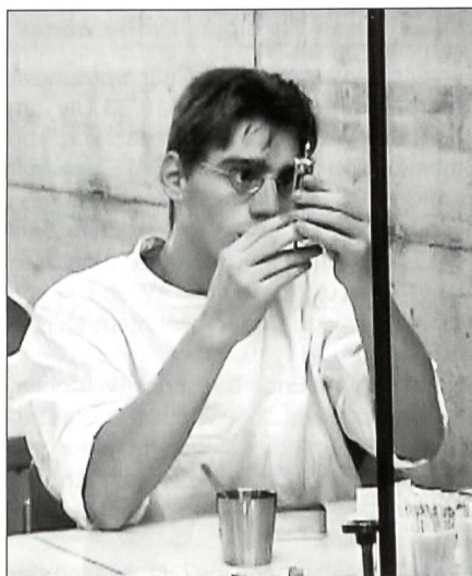
Probearbeiten im Labor.

Der Höhepunkt bildet «SPEED». Das Anwenden des Erlernten gibt einen Einblick und Erfahrungen im Führen einer Gruppe. Mir als KI L gibt diese Übung Recht; die Praxis hat einen viel höheren Ausbildungseffekt als der theoretische Unterricht. Der Rückblick dieser Woche und Ausblick auf die dritte beenden eine Phase, die mich Substanz gekostet und gefordert hat. Die hoch gesteckten Ziele der Woche erreichte ich nicht. Ich konnte die HK nicht abschliessen und mit der AM nicht beginnen.