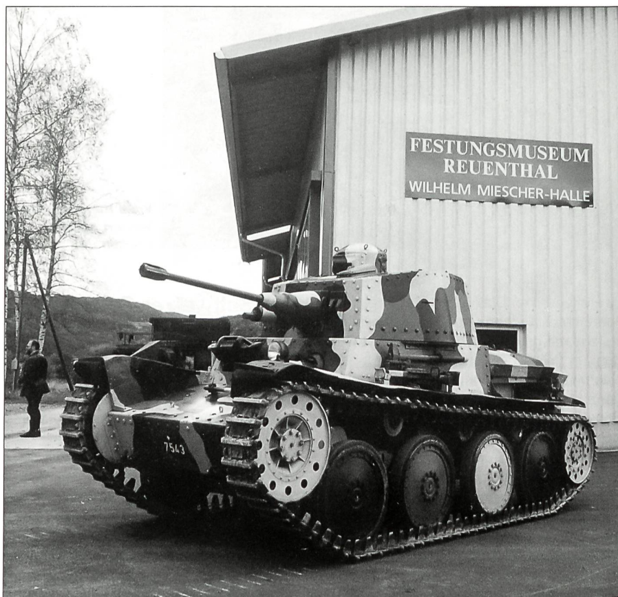
Panzerwagen 39 (Praga)

Seit April dieses Jahres ist in der Festung die Sonderausstellung über geheime Erd-