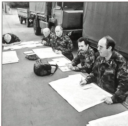
Vor der Abfahrt mussten die genauen Fahrstrecken und Fahrerwechsel auf der Karte eingetragen werden.

An festgelegten Punkten musste unterwegs zweimal ein Fahrerwechsel gemacht werden. Wohlbehalten und im Zeitplan erreichten alle Fahrzeuge das Truppenlager Rhonesand Ulrichen.