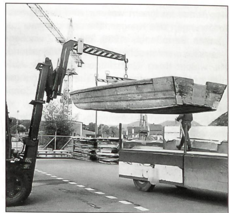
Ausgemustert: Das letzte Holz-Übersetzboot der Armee.

60 Pontonier- und Wasserfahrvereine (das sind zirka drei Viertel) unseres Landes erhalten ihre Boote zur vor- und ausserdienstlichen Ausbildung (leihweise) vom Zeughaus Brugg, das auch den Rekrutenschulen und WK-Einheiten die benötigten Schiffe zur Verfügung stellt. Ein weiteres Materialdepot für Boote der Armee befindet sich in Bulle. Ob Weidling, Ponton oder Übersetzboot (mit spezieller Heckwand für einen Aussenbordmotor): früher stunden im Zeughaus Brugg insgesamt rund 700 Holzschiffe der verschiedenen Macharten zu Diensten der Truppe und der erwähnten Vereine. Im Frühjahr 1981 wurden den Vereinen nebst den traditionellen Übersetzbooten und Weidlingen aus Holz versuchsweise erstmals etwa 100 Polyester-Weidlinge (mit Aluminium-Sohlenkante) abgegeben. 1988 hat die Rekrutenschule (parallel zur Ausbildung mit den Holzschiffen) die ersten Kunststoff-Übersetzboote getestet. Damit wurde das