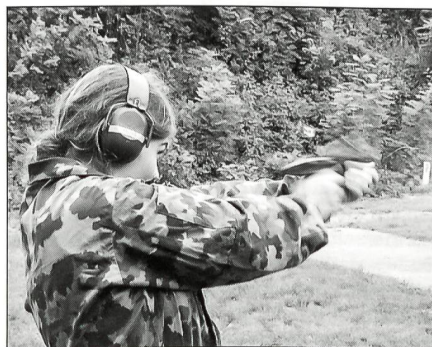
Das Damenteam der UOG Zürichsee rechtes Ufer beim Pistolenschiessen.

Eine Besonderheit stellte auch der Orientierungslauf dar. Auf der Strecke befanden sich