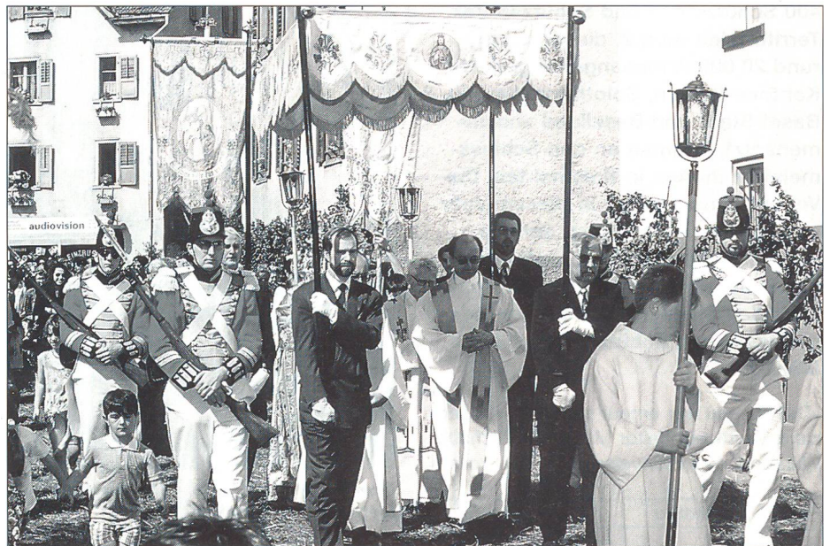
Grenadiere der Cumpagnia da mats (königlich-neapolitanisches 3. Schweizerregiment um 1830 bzw. 1850) flankieren während der Prozession das Allerheiligste.

Es folgte die Ernennung zum Leutnant und die Umteilung zu den franco-belgischen Zuaven, mit denen Thomale an den Schlachten bei Castelfidardo (18. 09. 1860) und Mentana (03. 11. 1867) teilnahm. Als Hauptmann führte er die 8. Zuaven-Kompanie. Während des Deutsch-Französischen Krieges von 1870/71 kämpfte Thomale in den Reihen der französischen «Légion des volontaires de l'Ouest». Thomale galt, wie es im Nekrolog hiess, als «offene, gerade Soldatennatur ohne Falsch und Hehl», war «obgleich von eher