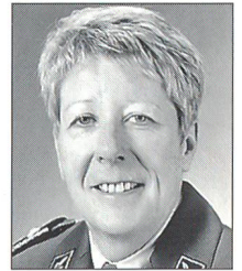
Brigadier Doris Portmann

Ausgangspunkt ist die völlig neu konzipierte Aushebung. Geplant ist, dass sie für alle Armeeingehörigen ein bis drei Tage dauern wird. Klare Anforderungsprofile für jede in der Armee vorhandene Funktion werden die Grundlage für die Examinierung sämtlicher Absolventinnen und Absolventen der Aushebung bilden. Die Eig-